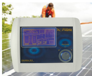
Control unit for photovoltaic solar installations