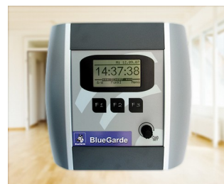
House control unit