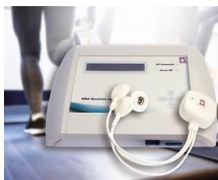
WBA receiver unit for measuring biosignals