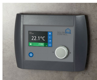
Solar Control Panel