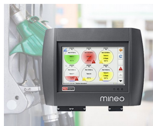
Controller for intelligent tank management