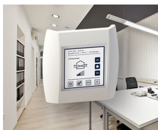
Indoor air quality control