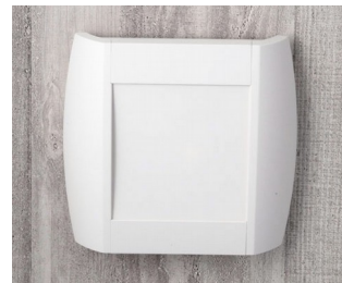
A9093107 DIATEC S ABS (UL 94 HB) off-white RAL 9002 210x48x200mm IP 40