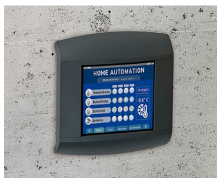
Control panel for home automation