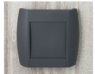
A9093108 DIATEC S ABS (UL 94 HB) lava 210x48x200mm IP 40