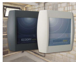
Systems for drying brickwork