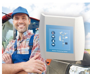
Weather Monitoring Station