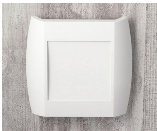
A9092107 DIATEC XS ABS (UL 94 HB) off-white RAL 9002 150x37x155mm IP 40