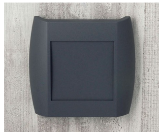
A9092108 DIATEC XS ABS (UL 94 HB) lava 150x37x155mm IP 40