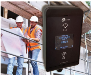
RFID card reader for construction site workers