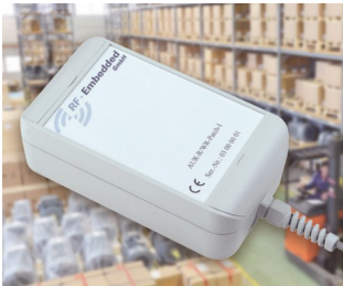
Active UHF RFID system