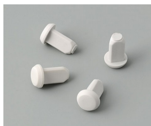
C2299018 Case feet TPE (UL 94 HB)