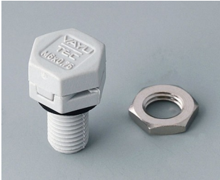
C2306917 Pressure equalisation element M6x0.75 PA 6 (UL 94 HB) light grey RAL 7035 IP 56