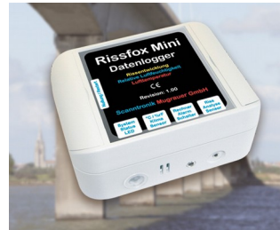
Miniature data logger for crack displacements and climatic data