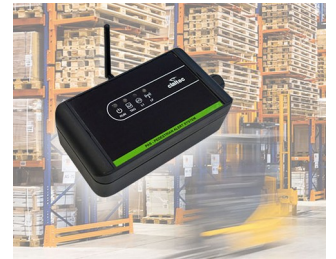
Pedestrian Alert System