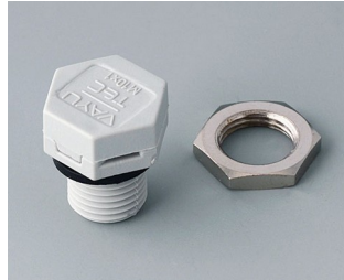
C2310917 Pressure equalisation element M10x1 PA 6 (UL 94 HB) light grey RAL 7035 IP 56