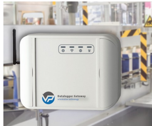
Data logger for machine monitoring