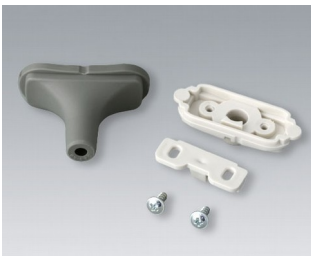
B2911318 Cable gland kit, 4.2 - 5.0 TPE volcano