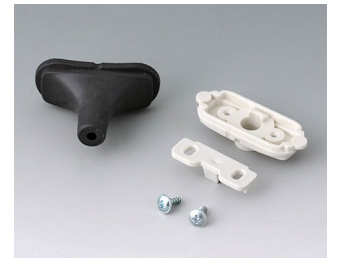
B2911309 Cable gland kit, 3.4 - 4.2 TPE black RAL 9005