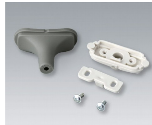
B2911308 Cable gland kit, 3.4 - 4.2 TPE volcano