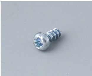
A0304031 Self-tapping screws 2.2 x 5 mm (PZ1)

Salvo modifiche tecniche. © OKW Gehäusesysteme, Buchen/Germania.