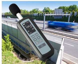
Noise level measurement