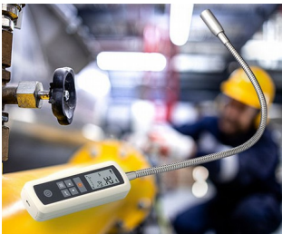
Gas leak detector