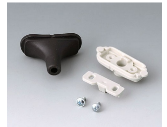
B2911329 Cable gland kit, 5.0 - 5.9 TPE black RAL 9005