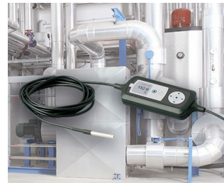
Process monitoring with temperature sensor