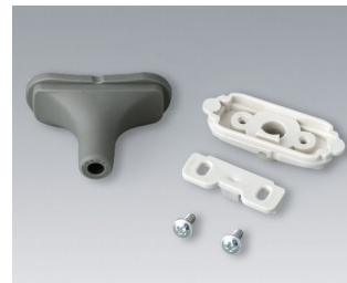
B2911328 Cable gland kit, 5.0 - 5.9 TPE volcano