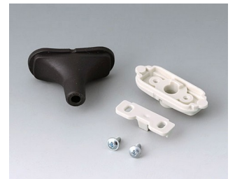
B2911329 Cable gland kit, 5.0 - 5.9 TPE black RAL 9005