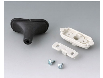
B2911309 Cable gland kit, 3.4 - 4.2 TPE black RAL 9005