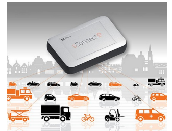
Module for smart mobility applications