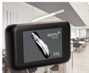
Sensor for measuring carbon dioxide concentration