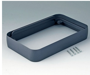
A9153018 Intermediate ring XL ABS (UL 94 HB) lava 96x154x26mm