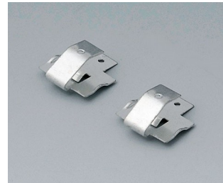
A9174006 Set of battery clips, 1 x 9 V Steel tin-plated