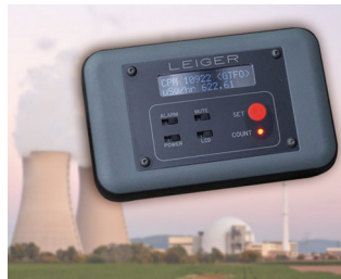
Geiger counter with logging function