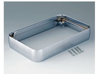
A9153011 Intermediate ring XL ABS (UL 94 HB) matt chromed 96x154x26mm