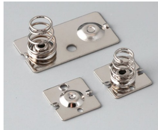
A9152010 Set of battery clips, 2/4 x AA Steel nickel-plated