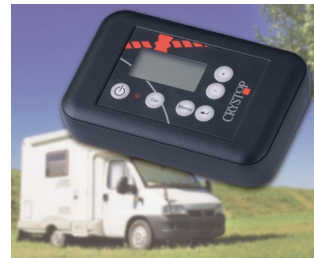
Remote control unit for AutoSat satellite receiver