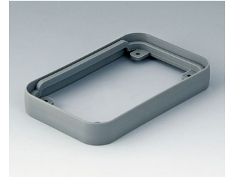
A9150118 Intermediate protection ring S SEBS (TPE) volcano 54x85x12mm