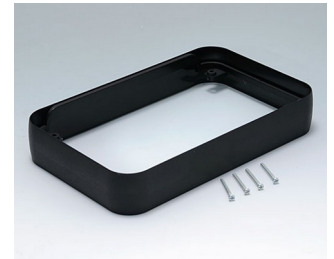
A9153219 Intermediate ring XL PMMA (IR) (UL 94 HB) black RAL 9005 96x154x26mm