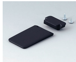
A9152059 Tilt foot bar ABS (UL 94 HB) black RAL 9005

Salvo modifiche tecniche. © OKW Gehäusesysteme, Buchen/Germania.