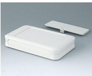
A9053117 SOFT-CASE XL ABS (UL 94 HB) off-white RAL 9002 92x150x28mm IP 40