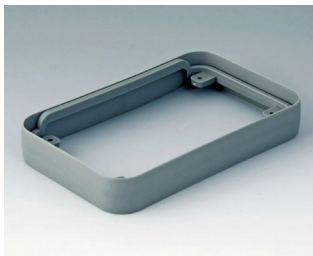
A9151118 Intermediate protection ring M SEBS (TPE) volcano 68x108x16mm