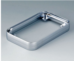
A9150011 Intermediate ring S ABS (UL 94 HB) matt chromed 54x85x12mm