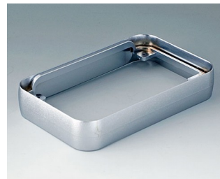
A9152011 Intermediate ring L ABS (UL 94 HB) matt chromed 76x120x21mm