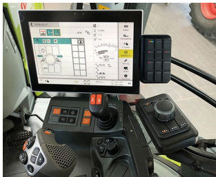
Digital joystick for ISO bus machines