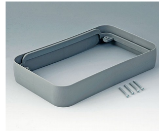
A9153118 Intermediate ring XL SEBS (TPE) volcano 96x154x26mm