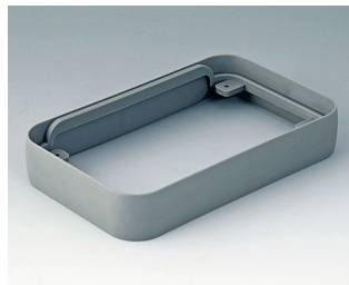
A9152118 Intermediate protection ring L SEBS (TPE) volcano 76x120x21mm