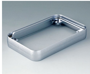
A9151011 Intermediate ring M ABS (UL 94 HB) matt chromed 68x108x16mm