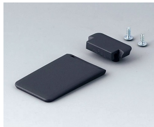
A9152058 Tilt foot bar ABS (UL 94 HB) lava