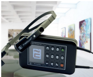
Multimedia audioguide for museums