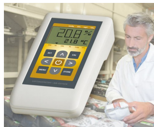
Misuratore di ossigeno in aria