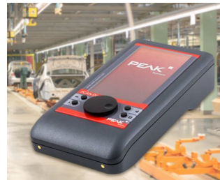
Mobile diagnostic device for CAN and CAN FD buses