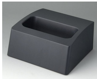
A9107508 Station L ASA+PC (UL 94 V-0) lava