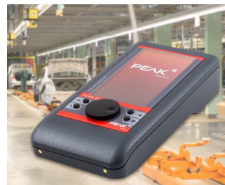
Mobile diagnostic device for CAN and CAN FD buses