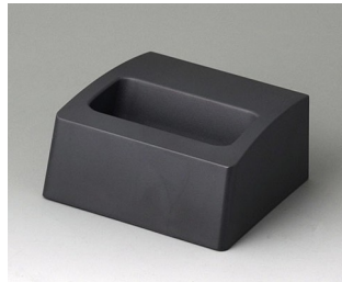
A9105508 Station S ASA+PC (UL 94 V-0) lava