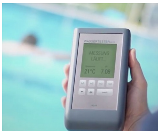
Electronic pool tester