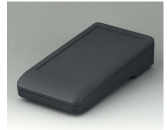
A9006118 DATEC-COMPACT M ASA+PC (UL 94 V-0) lava 172x92x39mm IP 41