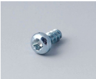
A0305031 Self-tapping screws 2.5 x 6 mm (PZ1)