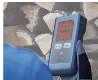
Wood moisture measuring device