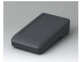
A9005118 DATEC-COMPACT S ASA+PC (UL 94 V-0) lava 136x74x32mm IP 41