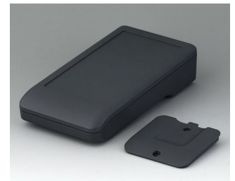
A9006218 DATEC-COMPACT M ASA+PC (UL 94 V-0) lava 172x92x39mm IP 41