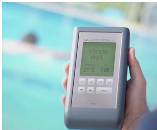
Electronic pool tester