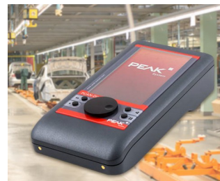
Mobile diagnostic device for CAN and CAN FD buses