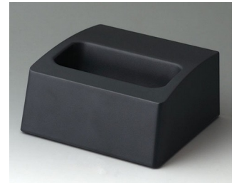
A9106508 Station M ASA+PC (UL 94 V-0) lava