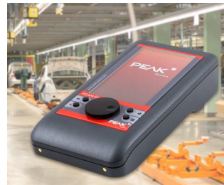
Mobile diagnostic device for CAN and CAN FD buses