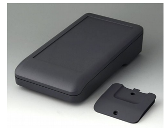
A9007218 DATEC-COMPACT L ASA+PC (UL 94 V-0) lava 206x110x47mm IP 41