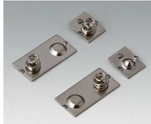
A9190024 Set of battery clips, 3 x AAA Steel nickel-plated