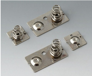
A9190023 Set of battery clips, 3 x AA Steel nickel-plated