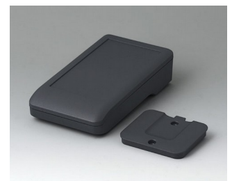
A9005218 DATEC-COMPACT S ASA+PC (UL 94 V-0) lava 136x74x32mm IP 41