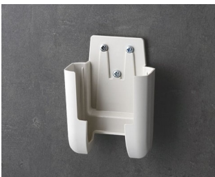
A9105627 Holder S ASA+PC (UL 94 V-0) off-white RAL 9002