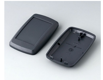
B9004808 Bottom and top part EM ABS (UL 94 HB) lava 68x42x18mm