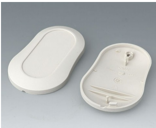
B9004907 Bottom and top part DM ABS (UL 94 HB) off-white RAL 9002 70x44x16mm