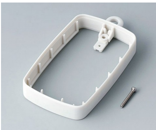
B9004787 Intermediate ring EM, high SEBS (TPE) off-white RAL 9002