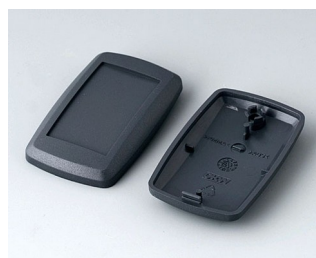
B9002808 Bottom and top part ES ABS (UL 94 HB) lava 52x32x15mm