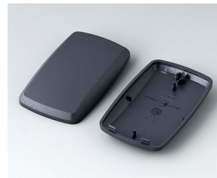
B9004858 Bottom and top part EM ABS (UL 94 HB) lava 68x42x18mm