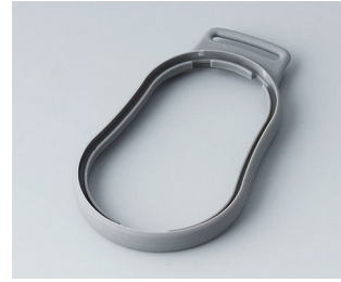
B9004308 Intermediate ring DM TPE volcano