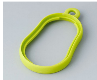
B9002354 Intermediate ring DS TPE green