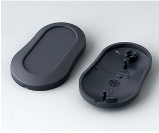
B9002908 Bottom and top part DS ABS (UL 94 HB) lava 51x32x13mm