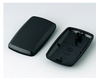
B9002856 Bottom and top part ES PMMA (IR) (UL 94 HB) black RAL 9005 52x32x15mm