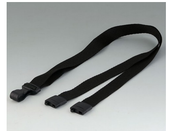
B9100073 Carrying strap, textile lanyard black 914x16mm