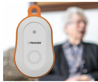
LoRa GPS tracker with alarm button