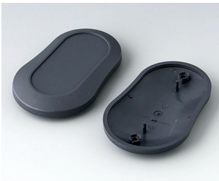
B9006908 Bottom and top part DL ABS (UL 94 HB) lava 84x53x19mm