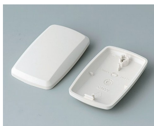
B9002857 Bottom and top part ES ABS (UL 94 HB) off-white RAL 9002 52x32x15mm