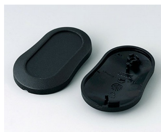
B9002906 Bottom and top part DS PMMA (IR) (UL 94 HB) black RAL 9005 51x32x13mm