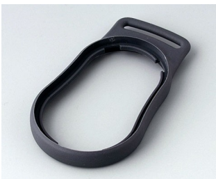
B9002302 Intermediate ring DS TPE lava