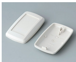
B9002807 Bottom and top part ES ABS (UL 94 HB) off-white RAL 9002 52x32x15mm