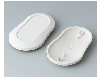
B9006907 Bottom and top part DL ABS (UL 94 HB) off-white RAL 9002 84x53x19mm