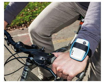
Mobile air quality monitoring