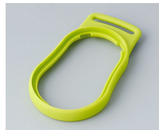
B9002304 Intermediate ring DS SEBS (TPE) green