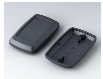
B9006818 Bottom and top part EL ABS (UL 94 HB) lava 78x48x24mm