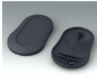
B9004908 Bottom and top part DM ABS (UL 94 HB) lava 70x44x16mm