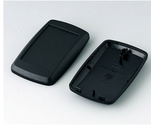
B9004806 Bottom and top part EM PMMA (IR) (UL 94 HB) black RAL 9005 68x42x18mm