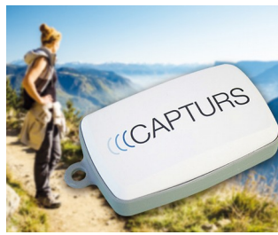
GPS tracking in real time