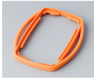
B9002753 Intermediate ring ES TPE orange