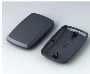
B9006858 Bottom and top part EL ABS (UL 94 HB) lava 78x48x20mm