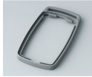
B9002708 Intermediate ring ES TPE volcano