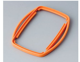
B9006753 Intermediate ring EL TPE orange