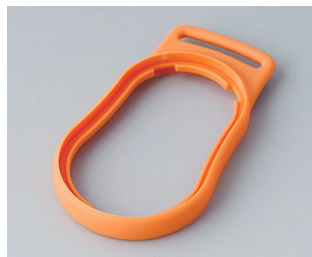
B9002303 Intermediate ring DS SEBS (TPE) orange