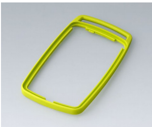
B9006704 Intermediate ring EL SEBS (TPE) green