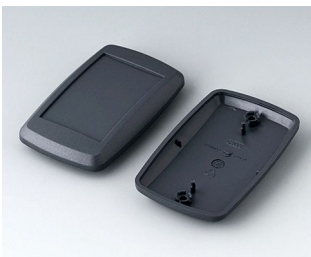
B9006808 Bottom and top part EL ABS (UL 94 HB) lava 78x48x20mm