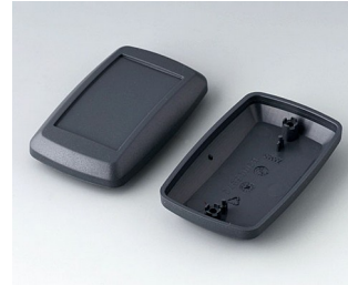
B9006828 Bottom and top part EL ABS (UL 94 HB) lava 78x48x26mm