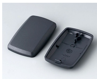
B9002858 Bottom and top part ES ABS (UL 94 HB) lava 52x32x15mm