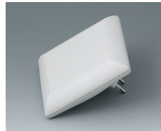
B5013227 ART-CASE S110 F PC+ABS (UL 94 V-0) off-white RAL 9002 110x110x38mm IP 40