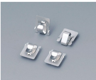
A9166001 Set of battery clips, 2 x AAA Steel tin-plated