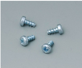
B5111201 Set of screws