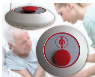
Radio paging mushroom-type button