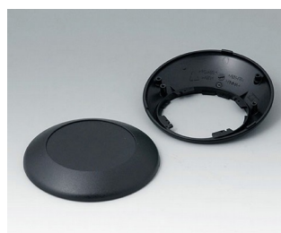
B5010209 Bottom and top part R110 F ABS (UL 94 HB) black RAL 9005 ø110x38mm