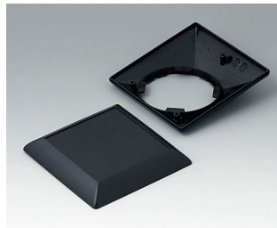
B5012209 Bottom and top part S110 F ABS (UL 94 HB) black RAL 9005 110x110x38mm