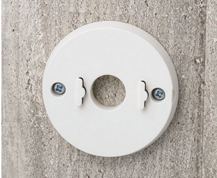
B5111307 Wall mounting set ABS (UL 94 HB) off-white RAL 9002