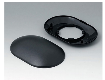
B5015109 Bottom and top part O160 H ABS (UL 94 HB) black RAL 9005 160x110x38mm