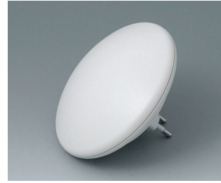
B5011127 ART-CASE R110 H PC+ABS (UL 94 V-0) off-white RAL 9002 ø110x38mm IP 40