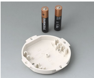
B5111107 Battery compartment, 2 x AAA ABS (UL 94 HB) off-white RAL 9002