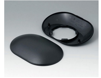
B5015309 Bottom and top part O160 H ABS (UL 94 HB) black RAL 9005 160x110x41mm