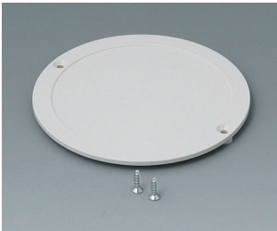
B5011857 Battery compartment lid ABS (UL 94 HB) off-white RAL 9002