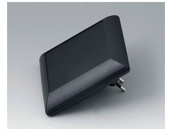
B5013229 ART-CASE S110 F PC+ABS (UL 94 V-0) black RAL 9005 110x110x38mm IP 40