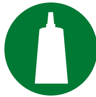
Confezionamento / montaggio