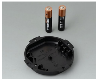
B5111109 Battery compartment, 2 x AAA ABS (UL 94 HB) black RAL 9005