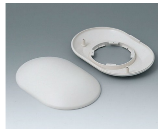
B5015107 Bottom and top part O160 H ABS (UL 94 HB) off-white RAL 9002 160x110x38mm