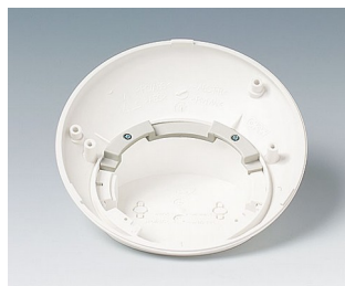
B5111707 Anti-rotation device ABS (UL 94 HB) off-white RAL 9002