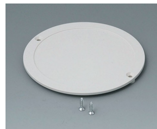
B5011847 Lid ABS (UL 94 HB) off-white RAL 9002