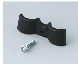
A9166003 Battery holder, 2 x AAA PA 6 (UL 94 HB) black RAL 9005