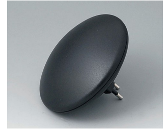
B5011129 ART-CASE R110 H PC+ABS (UL 94 V-0) black RAL 9005 ø110x38mm IP 40