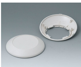
B5010207 Bottom and top part R110 F ABS (UL 94 HB) off-white RAL 9002 ø110x38mm