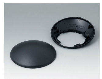
B5010309 Bottom and top part R110 H ABS (UL 94 HB) black RAL 9005 ø110x41mm