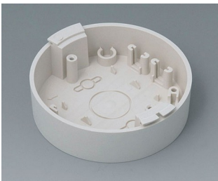
B5011117 Base ABS (UL 94 HB) off-white RAL 9002