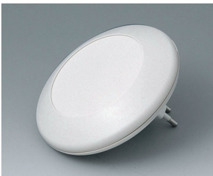
B5011227 ART-CASE R110 F PC+ABS (UL 94 V-0) off-white RAL 9002 ø110x38mm IP 40