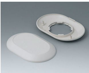
B5015007 Bottom and top part O160 F ABS (UL 94 HB) off-white RAL 9002 160x110x30mm