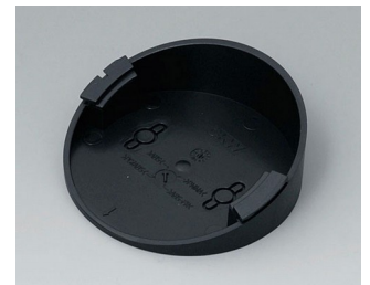
B5011219 Base 30° ABS (UL 94 HB) black RAL 9005