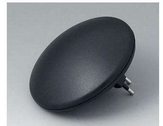
B5011329 ART-CASE R110 H PC+ABS (UL 94 V-0) black RAL 9005 ø110x41mm IP 40