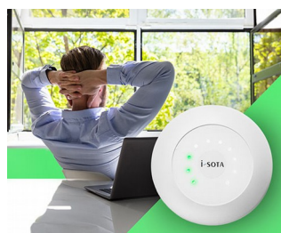
CO2 sensor traffic light