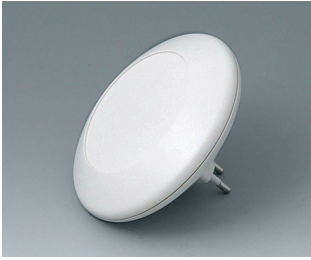
B5011027 ART-CASE R110 F PC+ABS (UL 94 V-0) off-white RAL 9002 ø110x30mm IP 40