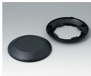
B5010009 Bottom and top part R110 F ABS (UL 94 HB) black RAL 9005 ø110x30mm