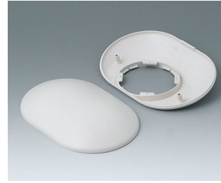
B5015307 Bottom and top part O160 H ABS (UL 94 HB) off-white RAL 9002 160x110x41mm