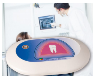
RFID Reader for the CTV system