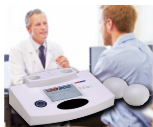
Multiple analytical resonance system