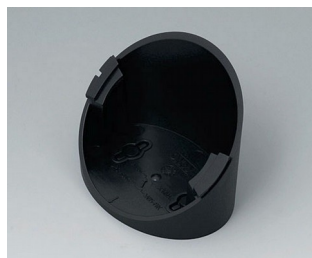
B5011319 Base 55° ABS (UL 94 HB) black RAL 9005