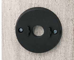
B5111309 Wall mounting set ABS (UL 94 HB) black RAL 9005