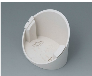
B5011317 Base 55° ABS (UL 94 HB) off-white RAL 9002