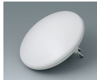
B5011327 ART-CASE R110 H PC+ABS (UL 94 V-0) off-white RAL 9002 ø110x41mm IP 40