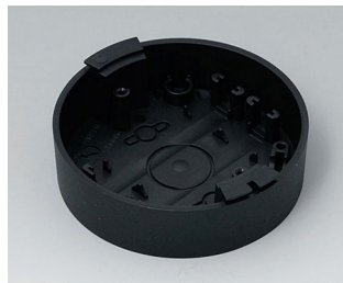
B5011119 Base ABS (UL 94 HB) black RAL 9005