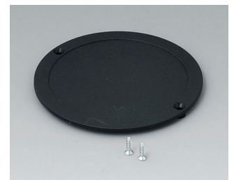
B5011849 Lid ABS (UL 94 HB) black RAL 9005