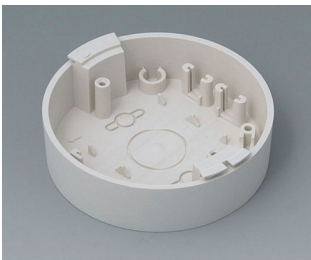
B5011117 Base ABS (UL 94 HB) off-white RAL 9002