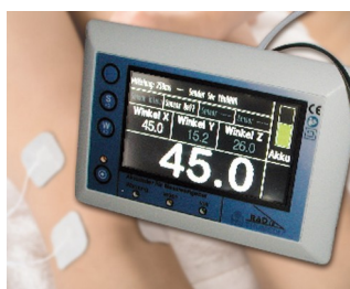
3D angle measurement of articulation systems on a gravity basis