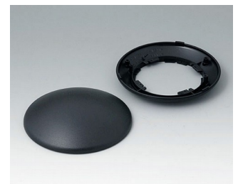
B5010109 Bottom and top part R110 H ABS (UL 94 HB) black RAL 9005 ø110x38mm