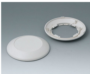
B5010007 Bottom and top part R110 F ABS (UL 94 HB) off-white RAL 9002 ø110x30mm