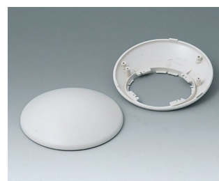
B5010307 Bottom and top part R110 H ABS (UL 94 HB) off-white RAL 9002 ø110x41mm