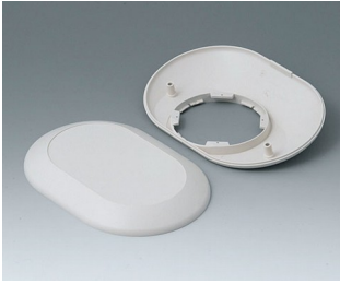
B5015207 Bottom and top part O160 F ABS (UL 94 HB) off-white RAL 9002 160x110x38mm