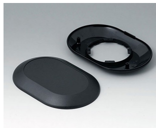
B5015009 Bottom and top part O160 F ABS (UL 94 HB) black RAL 9005 160x110x30mm