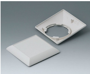
B5012207 Bottom and top part S110F ABS (UL 94 HB) off-white RAL 9002 110x110x38mm