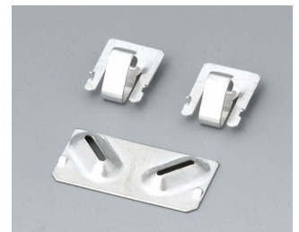
A9190002 Set of battery clips, 2xN/2xAA/2xAAA Steel tin-plated