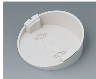
B5011217 Base 30° ABS (UL 94 HB) off-white RAL 9002