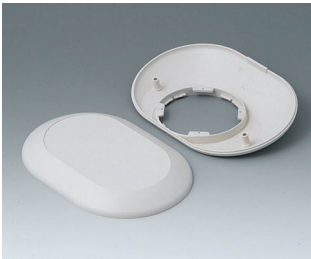
B5015207 Bottom and top part O160 F ABS (UL 94 HB) off-white RAL 9002 160x110x38mm