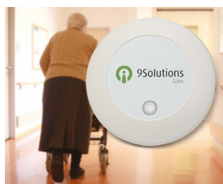
Access management in care facilities