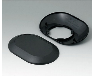
B5015209 Bottom and top part O160 F ABS (UL 94 HB) black RAL 9005 160x110x38mm