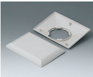
B5017207 Bottom and top part E160 F ABS (UL 94 HB) off-white RAL 9002 160x110x38mm