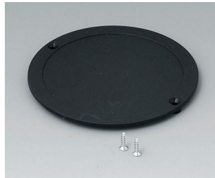
B5011859 Battery compartment lid ABS (UL 94 HB) black RAL 9005