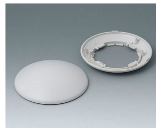
B5010107 Bottom and top part R110 H ABS (UL 94 HB) off-white RAL 9002 ø110x38mm