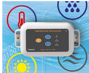
Data logger e.g. for temperature