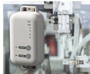
Data logger with gateway function