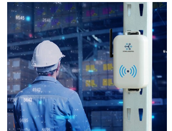
Smart store logistics