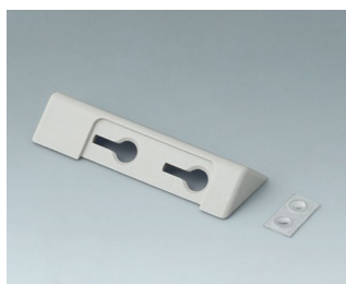
B4705207 Desktop stand set ASA+PC (UL 94 V-0)