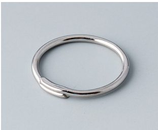
A9164001 Key ring Steel nickel-plated 20,5mm