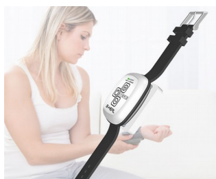
B-heal Hybrid Blood Zapper