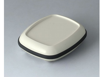
B1604217 BODY-CASE M, with recess ASA (UL 94 HB) traffic white RAL 9016 50x41x14mm IP 65