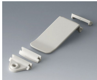
B1706001 Eyelet / pocket clip kit ASA (UL 94 HB) traffic white RAL 9016