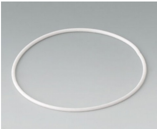
B1706003 Seal, for Station (Mountable) M/L