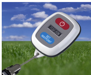
GPS tracking system