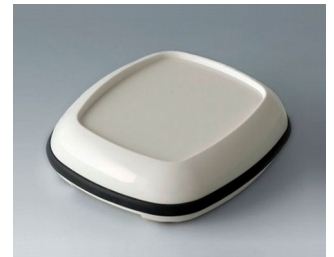
B1606217 BODY-CASE L, with recess ASA (UL 94 HB) traffic white RAL 9016 55x46x16mm IP 65