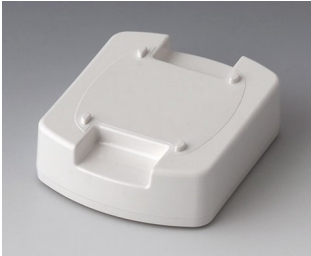
B1704017 Station M ASA (UL 94 HB) traffic white RAL 9016 62x50x17mm