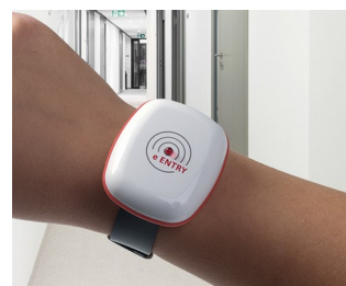
eEntry access and security controls