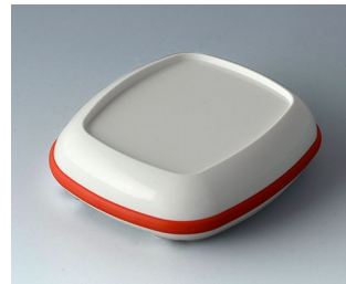
B1606207 BODY-CASE L, with recess ASA (UL 94 HB) traffic white RAL 9016 55x46x16mm IP 65