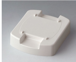
B1704807 Station M (Mountable) ASA (UL 94 HB) traffic white RAL 9016 62x50x17mm