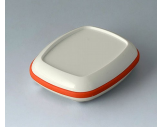
B1604207 BODY-CASE M, with recess ASA (UL 94 HB) traffic white RAL 9016 50x41x14mm IP 65