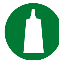
Confezionamento / montaggio