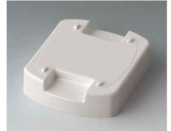
B1706807 Station L (Mountable) ASA (UL 94 HB) traffic white RAL 9016 62x50x17mm