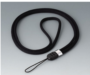
B9100063 Carrying strap, textile lanyard black 860mm