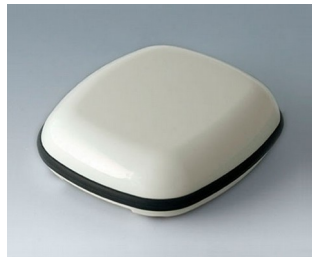
B1606117 BODY-CASE L, without recess ASA (UL 94 HB) traffic white RAL 9016 55x46x17mm IP 65