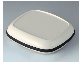
B1608217 BODY-CASE XL, with recess ASA (UL 94 HB) traffic white RAL 9016 62x56x17mm IP 65