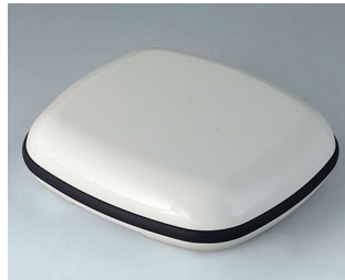
B1608117 BODY-CASE XL, without recess ASA (UL 94 HB) traffic white RAL 9016 62x56x18mm IP 65