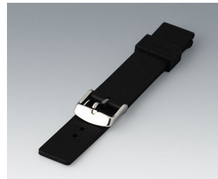
B1706202 Wrist strap, 18 mm Silicone black