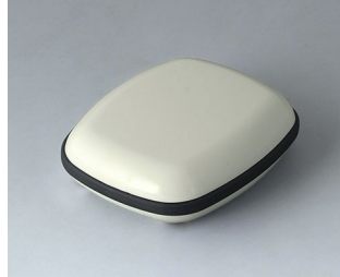
B1604117 BODY-CASE M, without recess ASA (UL 94 HB) traffic white RAL 9016 50x41x15mm IP 65