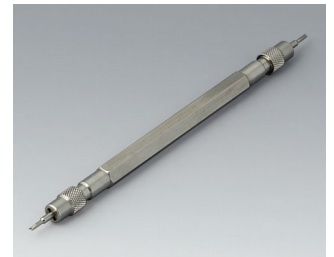
B1706203 Spring bar tool Stainless steel