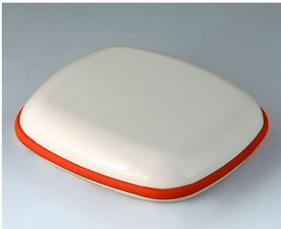
B1608107 BODY-CASE XL, without recess ASA (UL 94 HB) traffic white RAL 9016 62x56x18mm IP 65