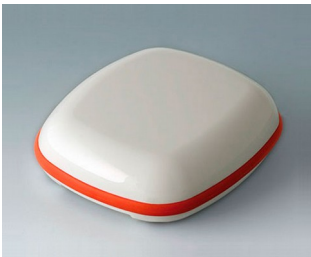
B1606107 BODY-CASE L, without recess ASA (UL 94 HB) traffic white RAL 9016 55x46x17mm IP 65