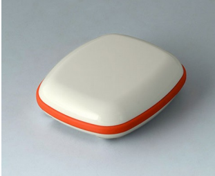
B1604107 BODY-CASE M, without recess ASA (UL 94 HB) traffic white RAL 9016 50x41x15mm IP 65