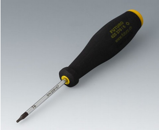
A0399T06 Torx T6 screwdriver

Salvo modifiche tecniche. © OKW Gehäusesysteme, Buchen/Germania.