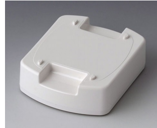
B1706017 Station L ASA (UL 94 HB) traffic white RAL 9016 62x50x17mm