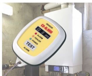
CO gas alert