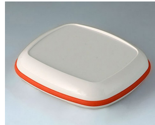
B1608207 BODY-CASE XL, with recess ASA (UL 94 HB) traffic white RAL 9016 62x56x17mm IP 65