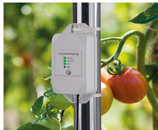
Data logger crop management