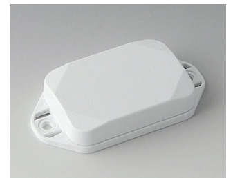
B1822127 MINI-DATA-BOX EF40, flat, with flanges ASA+PC (UL 94 V-0) traffic white RAL 9016 60x40x15mm IP 65 opt., IP 40