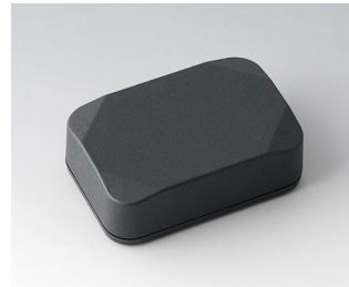
B1822218 MINI-DATA-BOX E40, high ASA+PC (UL 94 V-0) anthracite grey RAL 7016 60x40x20mm IP 65 opt., IP 40