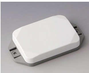
B1824126 MINI-DATA-BOX EF50, flat, with flanges ASA+PC (UL 94 V-0) traffic white RAL 9016 70x50x15mm IP 65 opt., IP 40