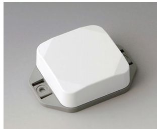
B1804226 MINI-DATA-BOX SF50, high, with flanges ASA+PC (UL 94 V-0) traffic white RAL 9016 50x50x20mm IP 65 opt., IP 40