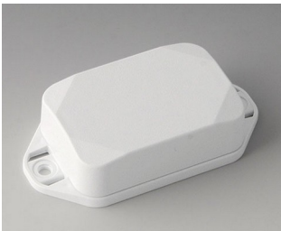
B1822227 MINI-DATA-BOX EF40, high, with flanges ASA+PC (UL 94 V-0) traffic white RAL 9016 60x40x20mm IP 65 opt., IP 40