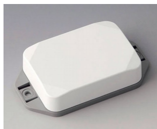
B1824226 MINI-DATA-BOX EF50, high, with flanges ASA+PC (UL 94 V-0) traffic white RAL 9016 70x50x20mm IP 65 opt., IP 40