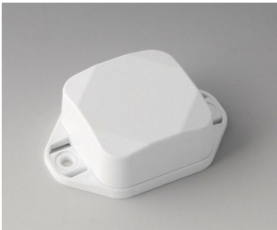
B1802227 MINI-DATA-BOX SF40, high, with flanges ASA+PC (UL 94 V-0) traffic white RAL 9016 40x40x20mm IP 65 opt., IP 40