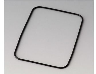
B1924101 Sealing E50/EF50

Salvo modifiche tecniche.