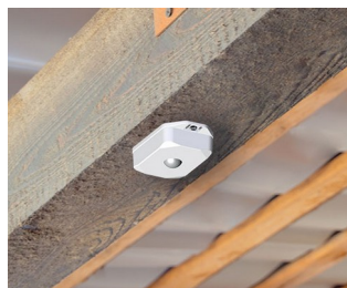
Motion detector with sensor for automatic control