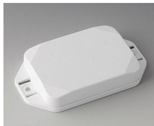
B1824127 MINI-DATA-BOX EF50, flat, with flanges ASA+PC (UL 94 V-0) traffic white RAL 9016 70x50x15mm IP 65 opt., IP 40