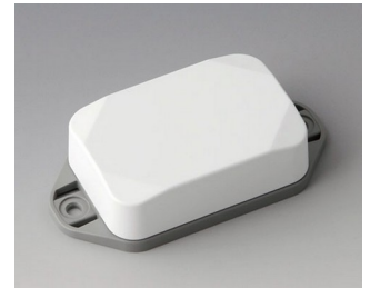
B1822226 MINI-DATA-BOX EF40, high, with flanges ASA+PC (UL 94 V-0) traffic white RAL 9016 60x40x20mm IP 65 opt., IP 40