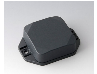
B1804228 MINI-DATA-BOX SF50, high, with flanges ASA+PC (UL 94 V-0) anthracite grey RAL 7016 50x50x20mm IP 65 opt., IP 40