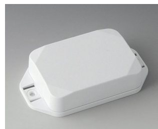
B1824227 MINI-DATA-BOX EF50, high, with flanges ASA+PC (UL 94 V-0) traffic white RAL 9016 70x50x20mm IP 65 opt., IP 40