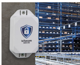
Access authorization of transponders