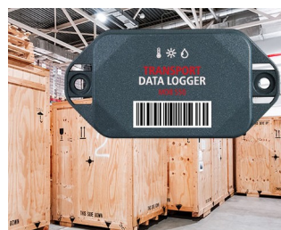
Data logger in transportation