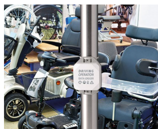
Data logger for Driving Operations