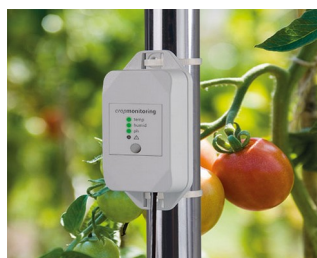
Data logger crop management