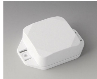
B1804227 MINI-DATA-BOX SF50, high, with flanges ASA+PC (UL 94 V-0) traffic white RAL 9016 50x50x20mm IP 65 opt., IP 40