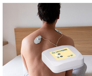
TENS device for pain therapy