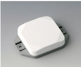
B1804126 MINI-DATA-BOX SF50, flat, with flanges ASA+PC (UL 94 V-0) traffic white RAL 9016 50x50x15mm IP 65 opt., IP 40