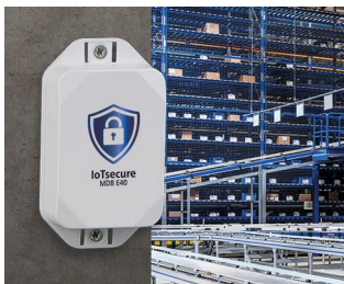
Access authorization of transponders