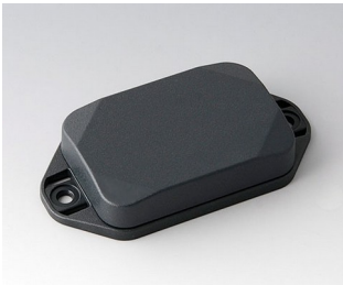
B1822128 MINI-DATA-BOX EF40, flat, with flanges ASA+PC (UL 94 V-0) anthracite grey RAL 7016 60x40x15mm IP 65 opt., IP 40