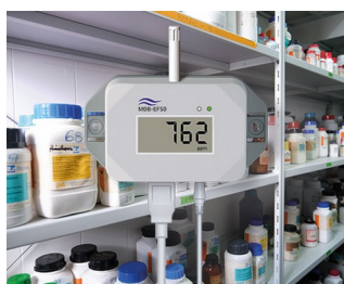
Gas detector for hazardous substances