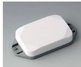
B1822126 MINI-DATA-BOX EF40, flat, with flanges ASA+PC (UL 94 V-0) traffic white RAL 9016 60x40x15mm IP 65 opt., IP 40