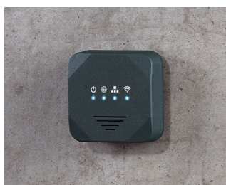
Wireless Access Point