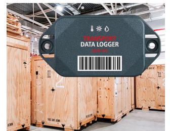
Data logger in transportation