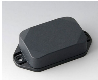
B1822228 MINI-DATA-BOX EF40, high, with flanges ASA+PC (UL 94 V-0) anthracite grey RAL 7016 60x40x20mm IP 65 opt., IP 40