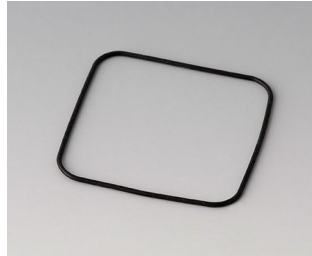
B1904101 Sealing S50/SF50