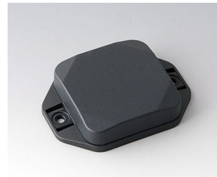
B1804128 MINI-DATA-BOX SF50, flat, with flanges ASA+PC (UL 94 V-0) anthracite grey RAL 7016 50x50x15mm IP 65 opt., IP 40