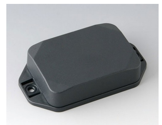
B1824228 MINI-DATA-BOX EF50, high, with flanges ASA+PC (UL 94 V-0) anthracite grey RAL 7016 70x50x20mm IP 65 opt., IP 40