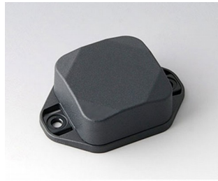
B1802228 MINI-DATA-BOX SF40, high, with flanges ASA+PC (UL 94 V-0) anthracite grey RAL 7016 40x40x20mm IP 65 opt., IP 40