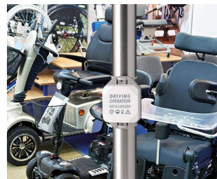
Data logger for Driving Operations