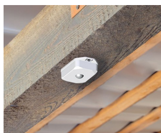
Motion detector with sensor for automatic control