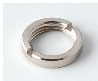
A6295009 Round nut 3/8"-32G

Salvo modifiche tecniche. © OKW Gehäusesysteme, Buchen/Germania.