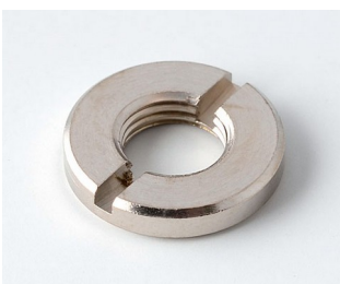
A6207009 Round nut M7 x 0.75