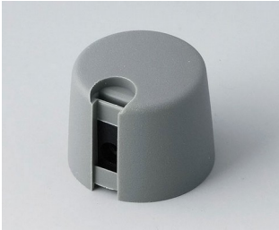
A1020648 TOP-KNOBS 20 PA 6 volcano 20x16mm