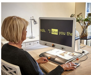
Control knobs for video magnifier