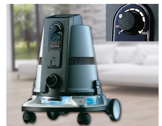
Operating element for a vacuum cleaner