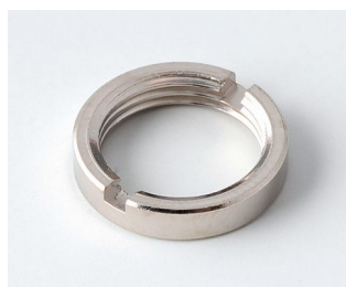
A6210009 Round nut M10 x 0.75