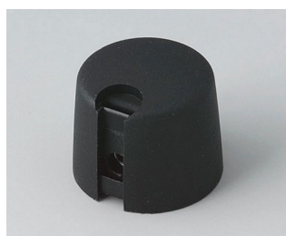
A1020069 TOP-KNOBS 20 PA 6 nero 20x16mm 6mm