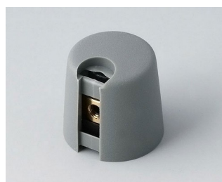
A1016068 TOP-KNOBS 16 PA 6 volcano 16x16mm 6mm