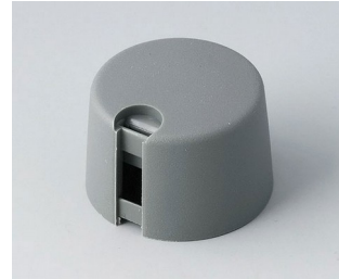
A1024048 TOP-KNOBS 24 PA 6 volcano 24x16mm 4mm