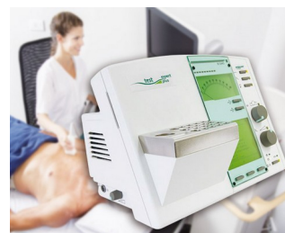
Operating element for a diagnostic device