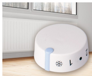
Integrated thermostat for electric storage heaters