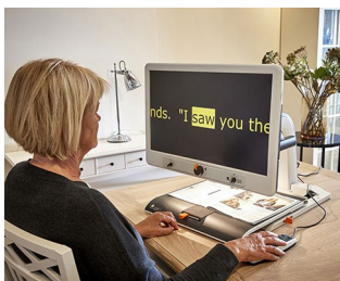
Control knobs for video magnifier