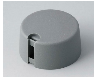
A1031048 TOP-KNOBS 31 PA 6 volcano 31x16mm 4mm