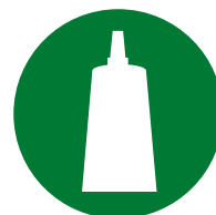
Confezionamento / montaggio