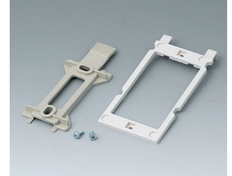
B1350048 Wall suspension elements ABS (UL 94 HB) pebble grey RAL 7032