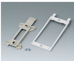
B1360048 Wall suspension elements ABS (UL 94 HB) pebble grey RAL 7032