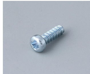
A0325080 Self-tapping screws 2.5 x 8 mm (PZ1)