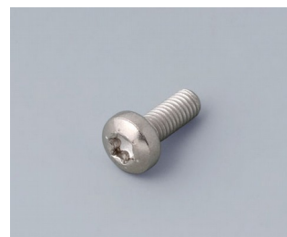
A0330080 Screw M3 x 8 mm (T10) Stainless steel