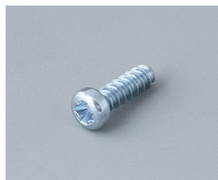
A0325080 Self-tapping screws 2.5 x 8 mm (PZ1)