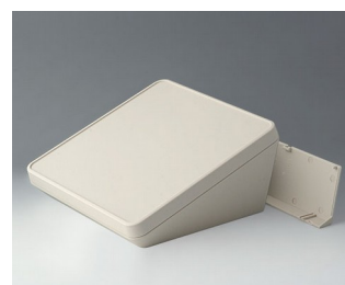
B4422207 PROTEC 220, Vers. II ASA+PC (UL 94 V-0) off-white RAL 9002 220x220x108mm IP 65 opt.