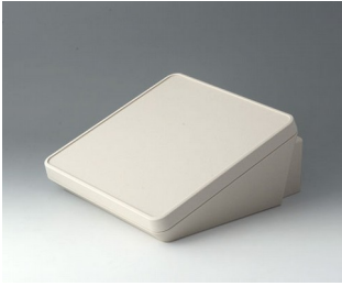
B4422307 PROTEC 220, Vers. III ASA+PC (UL 94 V-0) off-white RAL 9002 220x243x108mm IP 65 opt.