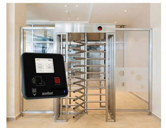
Terminal for access control