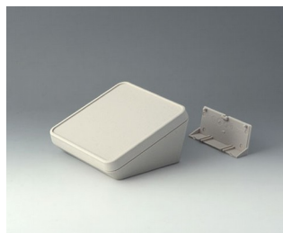
B4414207 PROTEC 140, Vers. II ASA+PC (UL 94 V-0) off-white RAL 9002 140x140x76mm IP 65 opt.