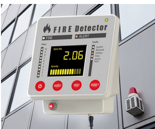
Terminal for fire alarm systems