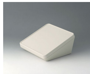
B4418107 PROTEC 180, Vers. I ASA+PC (UL 94 V-0) off-white RAL 9002 180x180x92mm IP 65 opt.