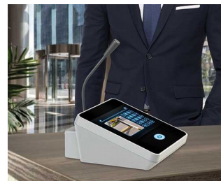
Table microphone / inter phone