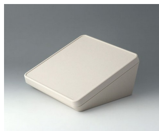
B4422107 PROTEC 220, Vers. I ASA+PC (UL 94 V-0) off-white RAL 9002 220x220x108mm IP 65 opt.