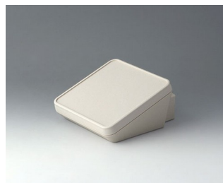
B4414307 PROTEC 140, Vers. III ASA+PC (UL 94 V-0) off-white RAL 9002 140x160x76mm IP 65 opt.