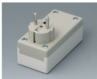
A9011665 PLUG CASE F / D, Vers. I PC+ABS (UL 94 V-0) off-white RAL 9002 100x50x40mm