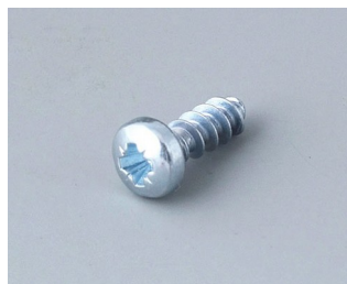
A0308031 Self-tapping screws 3 x 8 mm (PZ1)