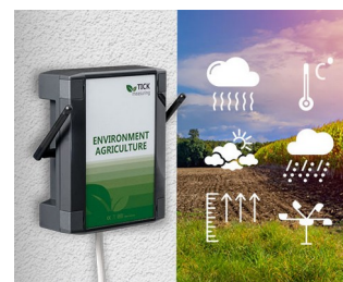
Weather station in agriculture