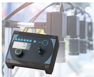
Camera control in production