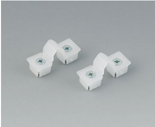
C2299031 Securing hinge for the cover PP natural-coloured