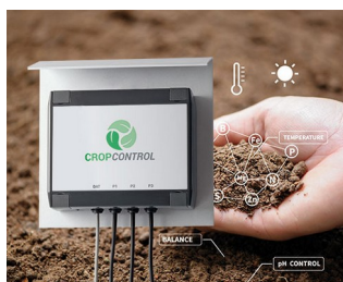
Smart Farming - system for long-term measurements