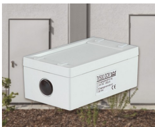
Electromechanical door locking device