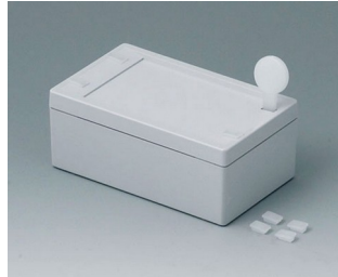
C3006101 SNAPTEC 60 x 100 ABS (UL 94 HB) light grey RAL 7035 60x100x40mm IP 65