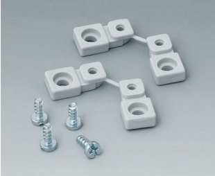
C2299028 Wall mounting brackets PA 6 (UL 94 HB) light grey RAL 7035