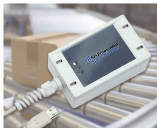
Robust UHF reader