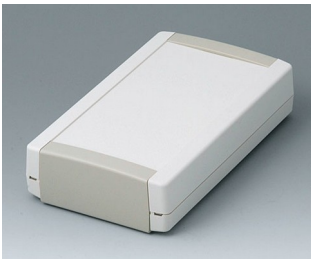
B1075365 TOPTEC 194 F, Vers. I ABS (UL 94 HB) off-white RAL 9002 194x115x46mm IP 40