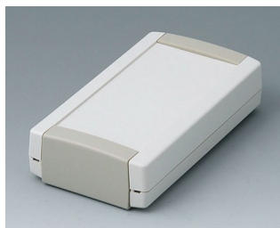
B1055365 TOPTEC 123 F, Vers. I ABS (UL 94 HB) off-white RAL 9002 123x68x30mm IP 40