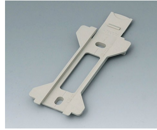
B1360028 Wall suspension element for Toptec 154 PC+ABS (UL 94 V-0) pebble grey RAL 7032