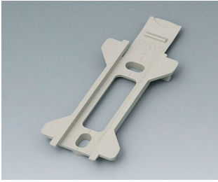
B1350028 Wall suspension element for Toptec 123 PC+ABS (UL 94 V-0) pebble grey RAL 7032