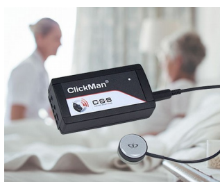
Adaptive multicontroller for single sensors