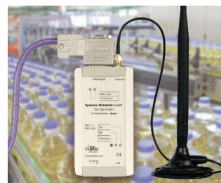
PROFIBUS radio system