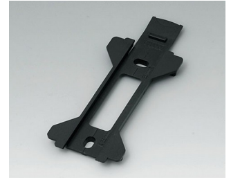
B1360029 Wall suspension element for Toptec 154 ABS (UL 94 HB) black RAL 9005