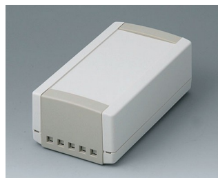
B1060465 TOPTEC 154 H, Vers. II ABS (UL 94 HB) off-white RAL 9002 154x84x56mm IP 40