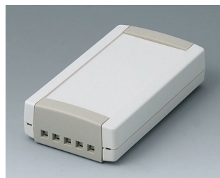
B1055465 TOPTEC 123 F, Vers. II ABS (UL 94 HB) off-white RAL 9002 123x68x30mm IP 40