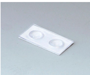
A9207150 Anti-slide feet 6.5 x 2 mm transparent