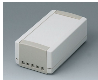
B1060465 TOPTEC 154 H, Vers. II ABS (UL 94 HB) off-white RAL 9002 154x84x56mm IP 40