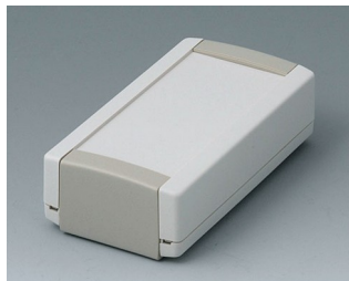
B1040365 TOPTEC 102, Vers. I ABS (UL 94 HB) off-white RAL 9002 102x54x30mm IP 40