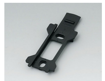
B1340029 Wall suspension element for Topotec 102 ABS (UL 94 HB) black RAL 9005