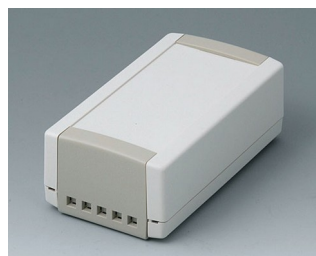
B1050465 TOPTEC 123 H, Vers. II ABS (UL 94 HB) off-white RAL 9002 123x68x45mm IP 40