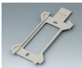
B1370028 Wall suspension element for Toptec 194 PC+ABS (UL 94 V-0) pebble grey RAL 7032