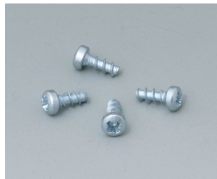
A9199008 Set of screws