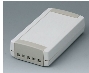
B1065465 TOPTEC 154 F, Vers. II ABS (UL 94 HB) off-white RAL 9002 154x84x38mm IP 40