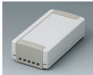
B1040465 TOPTEC 102, Vers. II ABS (UL 94 HB) off-white RAL 9002 102x54x30mm IP 40