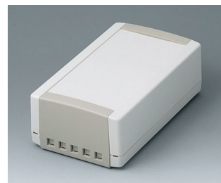
B1070465 TOPTEC 194 H, Vers. II ABS (UL 94 HB) off-white RAL 9002 194x115x68mm IP 40