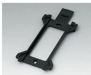
B1370029 Wall suspension element for Toptec 194 ABS (UL 94 HB) black RAL 9005