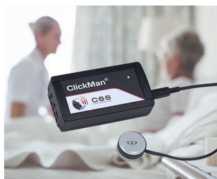
Adaptive multicontroller for single sensors