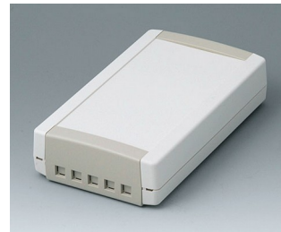
B1075465 TOPTEC 194 F, Vers. II ABS (UL 94 HB) off-white RAL 9002 194x115x46mm IP 40