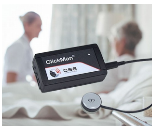
Adaptive multicontroller for single sensors