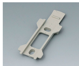
B1340028 Wall suspension element for Topotec 102 PC+ABS (UL 94 V-0) pebble grey RAL 7032