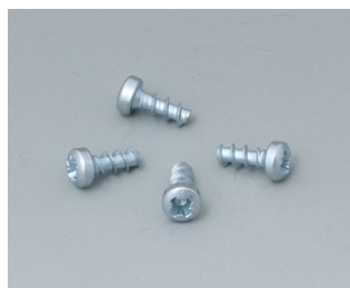
A9199008 Set of screws