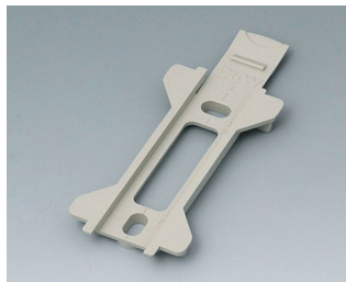
B1350028 Wall suspension element for Toptec 123 PC+ABS (UL 94 V-0) pebble grey RAL 7032