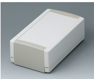
B1070365 TOPTEC 194 H, Vers. I ABS (UL 94 HB) off-white RAL 9002 194x115x68mm IP 40