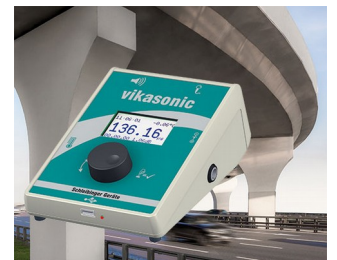
Ultrasonic measuring device