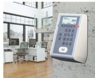
Time recording terminal