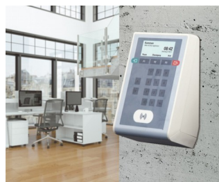
Time recording terminal