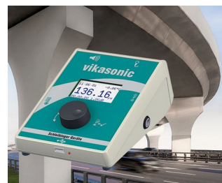
Ultrasonic measuring device