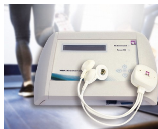
Unité réceptrice WBA pour la mesure de signaux biologiques