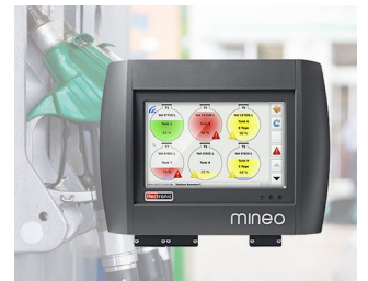
Contrôleur pour la gestion intelligente du réservoir