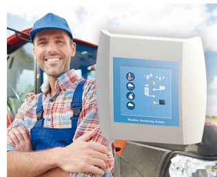
Station de surveillance météorologique