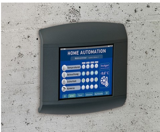
Panel d'intérieur/de contrôle en domotique