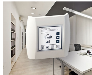
Contrôle de la qualité de l'air intérieur