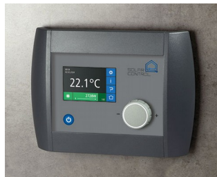
Solar Control Panel