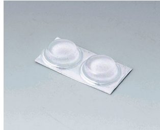
A9212330 Pieds anti-glissant 12 x 3,5 mm transparent

Sous réserve de modifications techniques. © OKW Gehäusesysteme, Buchen/Allemagne.