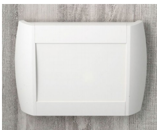
A9094107 DIATEC M ABS (UL 94 HB) gris blanc RAL 9002 270x48x200mm IP 40