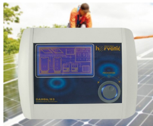
Commande d'une installation solaire photovoltaïque