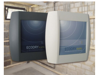
Systèmes de déshumidification des murs