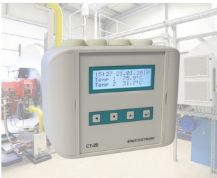
Régulateur de température universel/de température différentielle