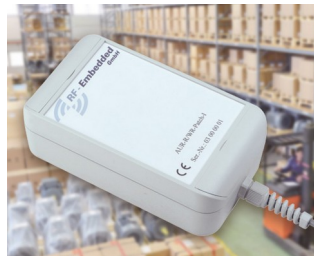
Système UHF RFID actif