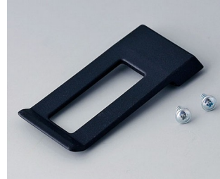
A9172109 Clip de poche ABS (UL 94 HB) noir RAL 9005 62x30mm