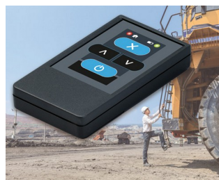
Émetteur radio pour machines