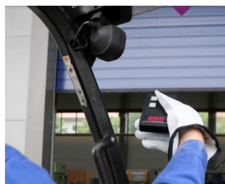
Télécommande IR pour environnements rudes