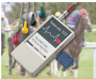
Système téléométrique ECG pour la médecine vétérinaire