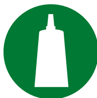
Assemblage / montage