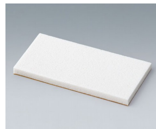
A9250251 Pièce de maintien PE cellulaire 50x25x3mm