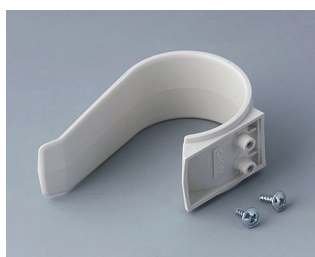
A9167027 Étrier de retenue PA 6 (UL 94 HB) gris blanc RAL 9002