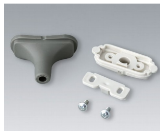
B2911328 Kit passe-câbles, 5,0 - 5,9 TPE volcan