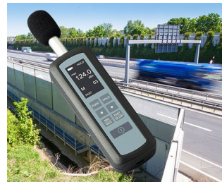
Mesure du niveau de bruit