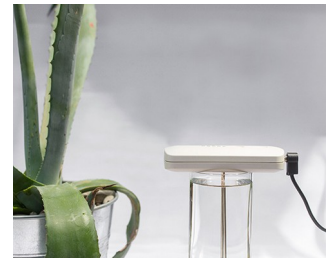
Production de solutions d'argent colloïdal