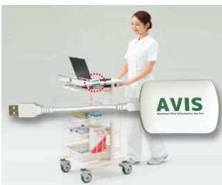
Récepteur pour la transmission de données