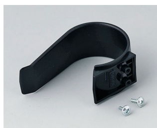
A9167029 Étrier de retenue PA 6 (UL 94 HB) noir RAL 9005