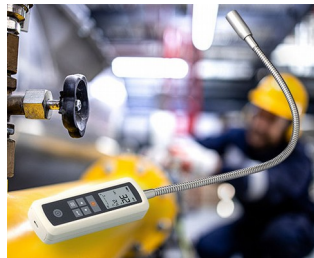
Détecteur de fuite de gaz