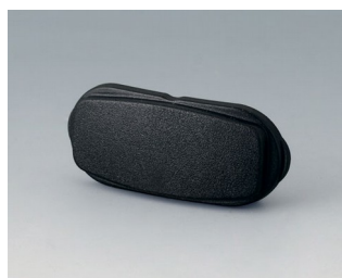
B2811209 Élément d'extrémité ASA+PC (UL 94 V-0) noir RAL 9005