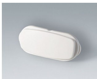
B2811207 Élément d'extrémité ASA+PC (UL 94 V-0) gris blanc RAL 9002