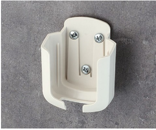
B2931507 Support M ASA+PC (UL 94 V-0) gris blanc RAL 9002