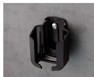
B2921509 Support S ASA+PC (UL 94 V-0) noir RAL 9005