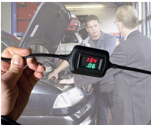
Affichage de la tension et du courant en mode maintien de charge