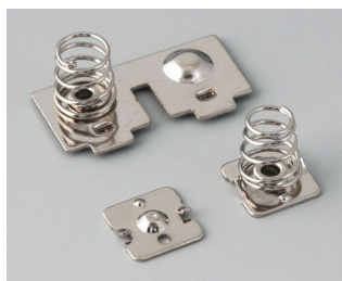
A9151010 Ressorts de contacts, 2 x AAA Acier nickelé