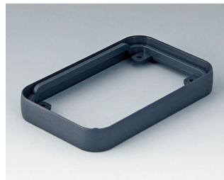
A9150018 Bague intermédiaire S ABS (UL 94 HB) lava 54x85x12mm