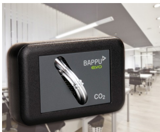
Capteur de mesure de la concentration de dioxyde de carbone