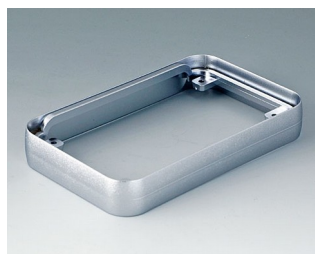
A9151011 Bague intermédiaire M ABS (UL 94 HB) mat-chromé 68x108x16mm