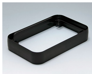
A9152219 Bague intermédiaire L PMMA (IR) (UL 94 HB) noir RAL 9005 76x120x21mm