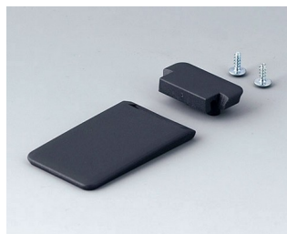
A9152058 Étrier basculable ABS (UL 94 HB) lava