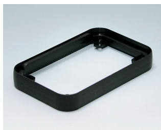
A9150219 Bague intermédiaire S PMMA (IR) (UL 94 HB) noir RAL 9005 54x85x12mm