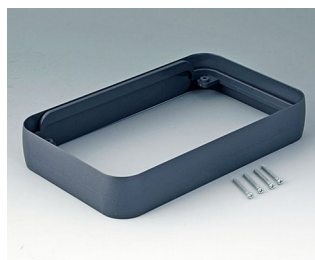
A9153018 Bague intermédiaire XL ABS (UL 94 HB) lava 96x154x26mm