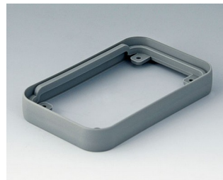
A9150118 Bague intermédiaire S SEBS (TPE) volcan 54x85x12mm