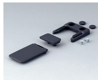
A9152048 Combi-clip ABS (UL 94 HB) lava 45x27mm