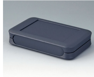
A9052108 SOFT-CASE L ABS (UL 94 HB) lava 73x117x24mm IP 54 opt., IP 40