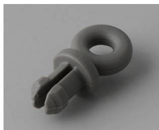
A9100002 Anneau PA 6 volcan