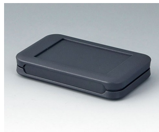
A9050108 SOFT-CASE S ABS (UL 94 HB) lava 51x82x14mm IP 54 opt., IP 40