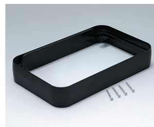
A9153219 Bague intermédiaire XL PMMA (IR) (UL 94 HB) noir RAL 9005 96x154x26mm