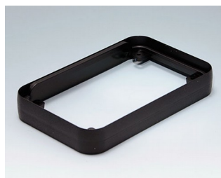
A9151219 Bague intermédiaire M PMMA (IR) (UL 94 HB) noir RAL 9005 68x108x16mm