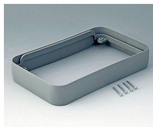
A9153118 Bague intermédiaire XL SEBS (TPE) volcan 96x154x26mm