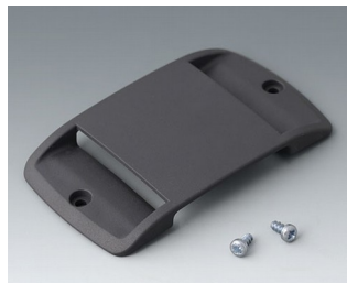
B9106128 Oeillet de fixation passe- dragonne ABS (UL 94 HB) lava