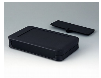
A9053219 SOFT-CASE XL PMMA (IR) (UL 94 HB) noir RAL 9005 92x150x28mm IP 40