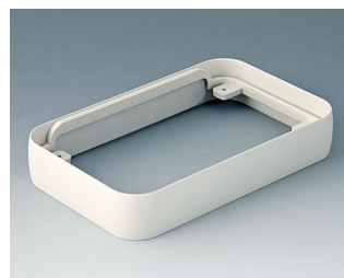
A9152017 Bague intermédiaire L ABS (UL 94 HB) gris blanc RAL 9002 76x120x21mm