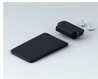
A9152059 Étrier basculable ABS (UL 94 HB) noir RAL 9005

Sous réserve de modifications techniques. © OKW Gehäusesysteme, Buchen/Allemagne.