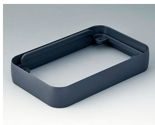
A9152018 Bague intermédiaire L ABS (UL 94 HB) lava 76x120x21mm