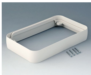
A9153017 Bague intermédiaire XL ABS (UL 94 HB) gris blanc RAL 9002 96x154x26mm