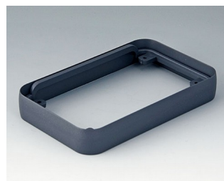
A9151018 Bague intermédiaire M ABS (UL 94 HB) lava 68x108x16mm