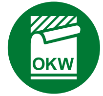
Étiquette, Films de décoration graphique