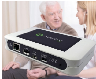
Localisation en temps réel dans le secteur des soins de santé