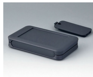
A9051118 SOFT-CASE M ABS (UL 94 HB) lava 65x105x19mm IP 40