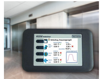
RIDEwatcher Multimeter for ride profiles