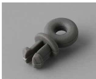
A9100001 Anneau PA 6 volcan