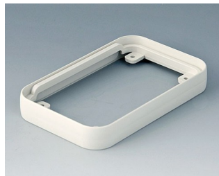
A9150017 Bague intermédiaire S ABS (UL 94 HB) gris blanc RAL 9002 54x85x12mm