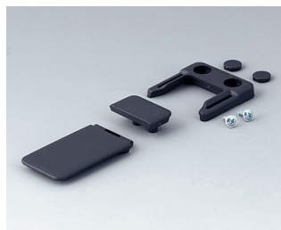
A9152048 Combi-clip ABS (UL 94 HB) lava 45x27mm