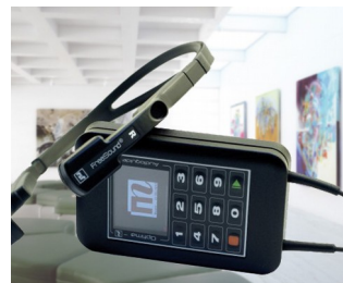
Guide audio multimédia pour les musées