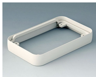
A9151017 Bague intermédiaire M ABS (UL 94 HB) gris blanc RAL 9002 68x108x16mm