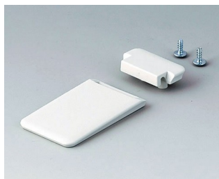
A9152057 Étrier basculable ABS (UL 94 HB) gris blanc RAL 9002