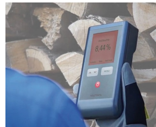
Testeur d'humidité du bois