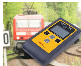
Multimètre testeur de phases