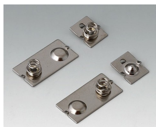
A9190024 Ressorts de contact, 3 x AAA Acier nickelé