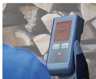
Testeur d'humidité du bois