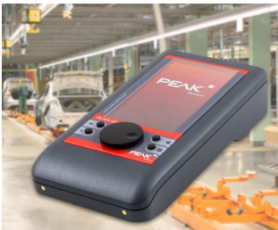
Appareil de diagnostic pour les bus CAN et CAN-FD