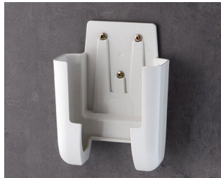
A9107627 Support L ASA+PC (UL 94 V-0) gris blanc RAL 9002