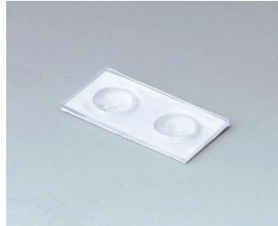
A9207150 Pieds anti-glissant 6,5 x 2 mm transparent

Sous réserve de modifications techniques. © OKW Gehäusesysteme, Buchen/Allemagne.