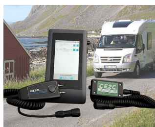
SYSTÈME DE CONTRÔLES DE PRESENCE D'HUMIDITE