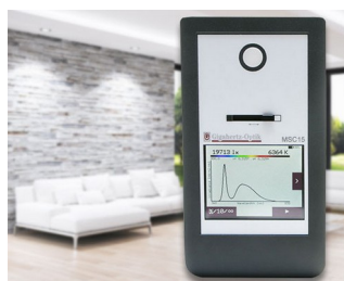
Instrument de mesure de la lumière spectrale