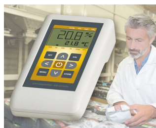
Instrument de mesure de l'oxygène de l'air