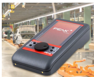
Appareil de diagnostic pour les bus CAN et CAN-FD