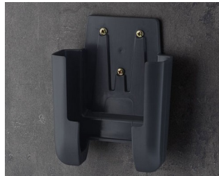
A9107628 Support L ASA+PC (UL 94 V-0) lava