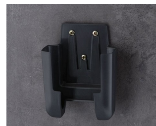
A9106628 Support M ASA+PC (UL 94 V-0) lava