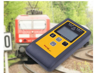
Multimètre testeur de phases