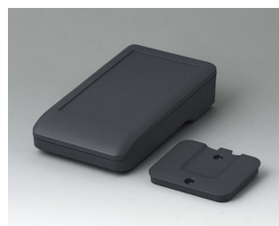
A9005218 DATEC-COMPACT S ASA+PC (UL 94 V-0) lava 136x74x32mm IP 41