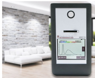
Instrument de mesure de la lumière spectrale