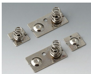
A9190023 Ressorts de contact, 3 x AA Acier nickelé