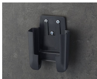
A9105628 Support S ASA+PC (UL 94 V-0) lava