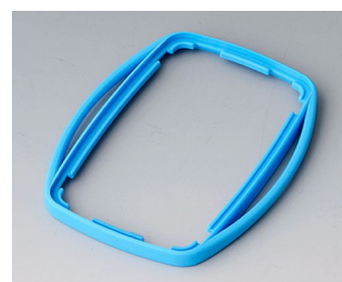
B9004755 Bague intermédiaire EM TPE bleu