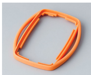
B9002753 Bague intermédiaire ES TPE orange