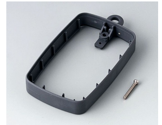
B9004782 Bague intermédiaire EM, surélevé SEBS (TPE) lava