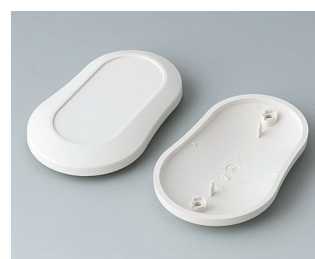
B9006907 Partie inférieure et supérieure DL ABS (UL 94 HB) gris blanc RAL 9002 84x53x19mm