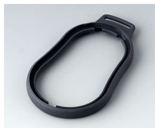
B9006302 Bague intermédiaire DL TPE lava