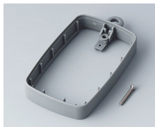
B9004788 Bague intermédiaire EM, surélevé TPE volcan