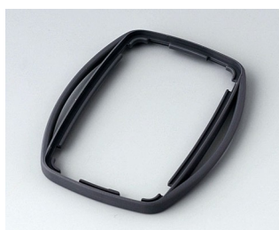
B9004752 Bague intermédiaire EM TPE lava