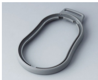
B9006308 Bague intermédiaire DL TPE volcan