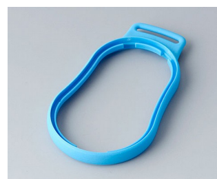
B9004305 Bague intermédiaire DM TPE bleu