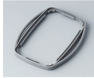
B9004758 Bague intermédiaire EM TPE volcan