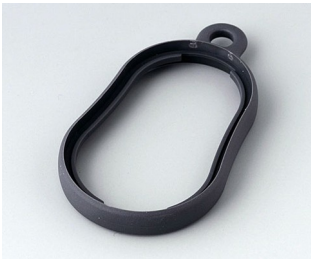
B9002352 Bague intermédiaire DS TPE lava