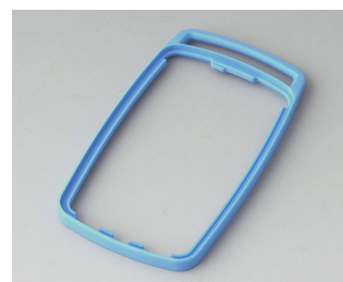
B9004705 Bague intermédiaire EM TPE bleu