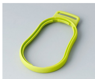
B9004304 Bague intermédiaire DM TPE vert