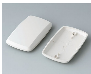
B9006857 Partie inférieure et supérieure EL ABS (UL 94 HB) gris blanc RAL 9002 78x48x20mm