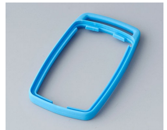
B9002705 Bague intermédiaire ES TPE bleu