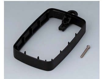
B9004786 Bague intermédiaire EM, surélevé PMMA (IR) (UL 94 HB) noir RAL 9005