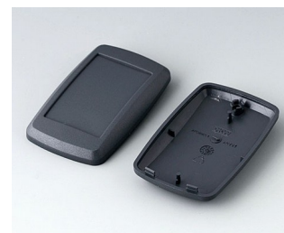
B9004808 Partie inférieure et supérieure EM ABS (UL 94 HB) lava 68x42x18mm