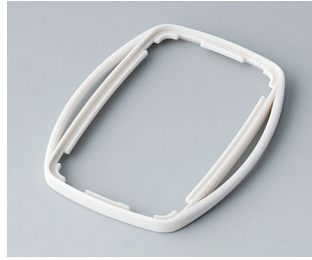
B9004757 Bague intermédiaire EM SEBS (TPE) gris blanc RAL 9002