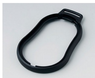
B9006306 Bague intermédiaire DL PMMA (IR) (UL 94 HB) noir RAL 9005