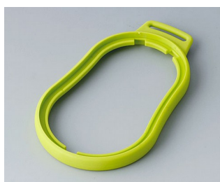
B9006304 Bague intermédiaire DL TPE vert