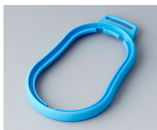
B9006305 Bague intermédiaire DL TPE bleu