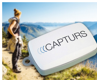
Tracker GPS en temps réel