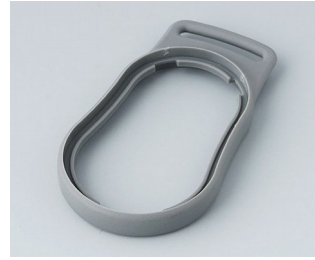
B9002308 Bague intermédiaire DS TPE volcan