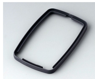
B9006782 Bague intermédiaire EL SEBS (TPE) lava