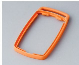
B9002703 Bague intermédiaire ES TPE orange