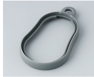
B9002358 Bague intermédiaire DS TPE volcan