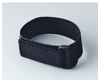
B9100033 Bracelet noir 280mm