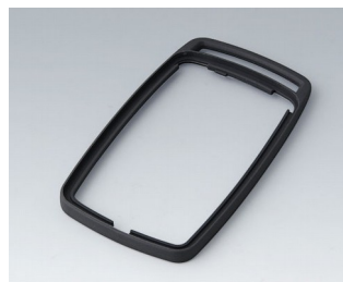
B9006702 Bague intermédiaire EL TPE lava