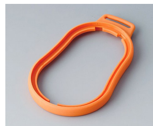
B9006303 Bague intermédiaire DL TPE orange