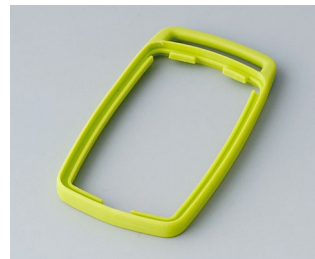
B9002704 Bague intermédiaire ES TPE vert