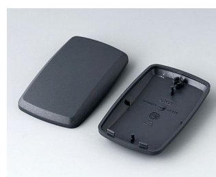
B9004858 Partie inférieure et supérieure EM ABS (UL 94 HB) lava 68x42x18mm