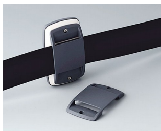
B9106108 Oeillet de fixation passe- dragonne EL ABS (UL 94 HB) lava