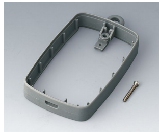
B9004778 Bague intermédiaire EM, Micro USB 5 P, B Type SMT SEBS (TPE) volcan