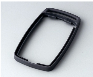
B9002702 Bague intermédiaire ES TPE lava