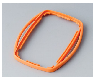
B9004753 Bague intermédiaire EM SEBS (TPE) orange