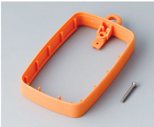
B9004783 Bague intermédiaire EM, surélevé TPE orange