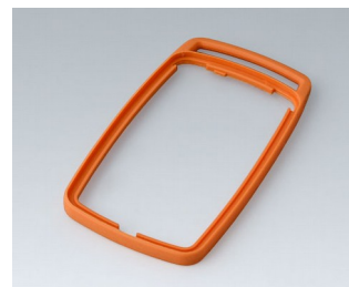
B9006703 Bague intermédiaire EL TPE orange