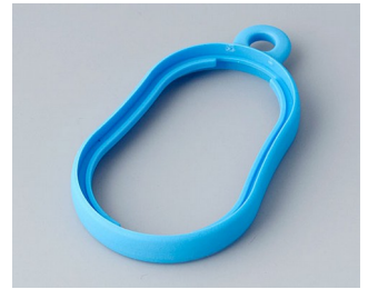
B9002355 Bague intermédiaire DS TPE bleu