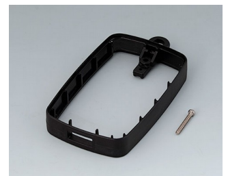
B9004796 Bague intermédiaire EM, type A USB PMMA (IR) (UL 94 HB) noir RAL 9005