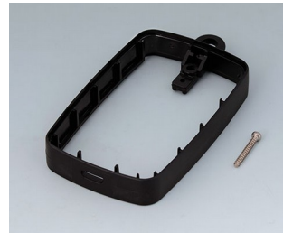
B9004779 Bague intermédiaire EM, Micro USB 5 P, B Type SMT ABS (UL 94 HB) noir RAL 9005