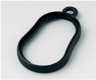
B9002356 Bague intermédiaire DS PMMA (IR) (UL 94 HB) noir RAL 9005