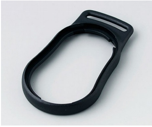
B9002306 Bague intermédiaire DS PMMA (IR) (UL 94 HB) noir RAL 9005