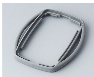
B9002758 Bague intermédiaire ES TPE volcan