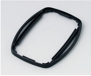
B9004756 Bague intermédiaire EM PMMA (IR) (UL 94 HB) noir RAL 9005