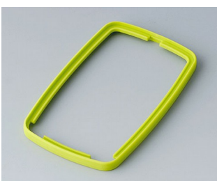
B9006784 Bague intermédiaire EL SEBS (TPE) vert