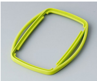
B9006754 Bague intermédiaire EL SEBS (TPE) vert