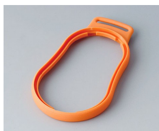
B9004303 Bague intermédiaire DM TPE orange