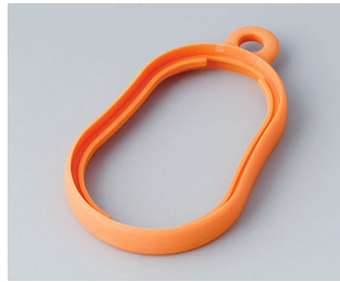
B9002353 Bague intermédiaire DS TPE orange