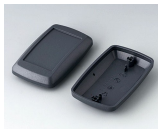
B9006828 Partie inférieure et supérieure EL ABS (UL 94 HB) lava 78x48x26mm