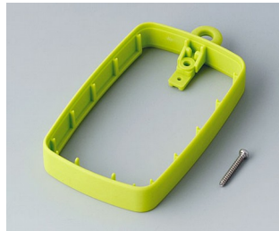
B9004784 Bague intermédiaire EM, surélevé SEBS (TPE) vert