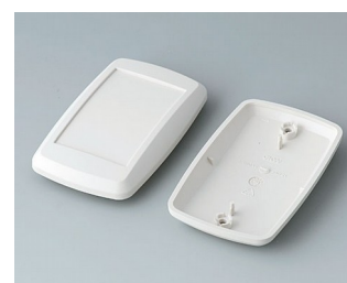
B9006807 Partie inférieure et supérieure EL ABS (UL 94 HB) gris blanc RAL 9002 78x48x20mm