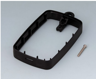
B9004776 Bague intermédiaire EM, Micro USB 5 P, B Type SMT PMMA (IR) (UL 94 HB) noir RAL 9005