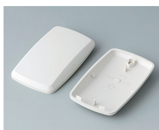
B9004857 Partie inférieure et supérieure EM ABS (UL 94 HB) gris blanc RAL 9002 68x42x18mm