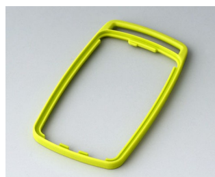
B9004704 Bague intermédiaire EM TPE vert