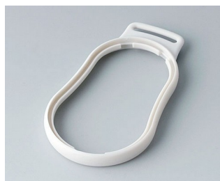
B9004307 Bague intermédiaire DM SEBS (TPE) gris blanc RAL 9002