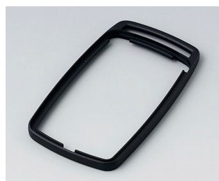
B9006706 Bague intermédiaire EL PMMA (IR) (UL 94 HB) noir RAL 9005