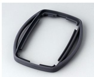
B9002752 Bague intermédiaire ES TPE lava