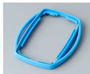
B9002755 Bague intermédiaire ES TPE bleu