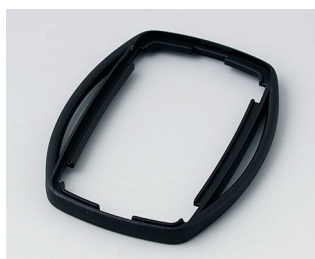
B9002756 Bague intermédiaire ES PMMA (IR) (UL 94 HB) noir RAL 9005