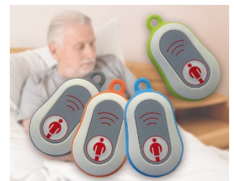
Émetteur d'appel radio en médaillon