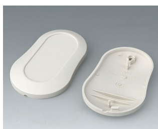
B9004907 Partie inférieure et supérieure DM ABS (UL 94 HB) gris blanc RAL 9002 70x44x16mm