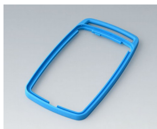
B9006705 Bague intermédiaire EL TPE bleu