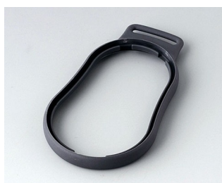
B9004302 Bague intermédiaire DM TPE lava