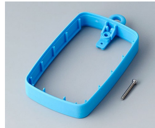
B9004785 Bague intermédiaire EM, surélevé TPE bleu