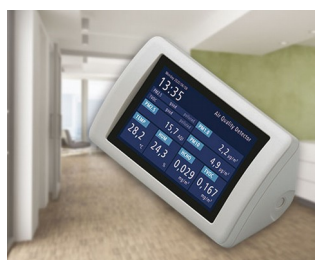
Appareil de mesure des aérosols