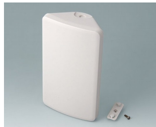
B4610107 SMART-CONTROL M, Vers. I ASA+PC (UL 94 V-0) gris blanc RAL 9002 173x101x59mm IP 55 opt., IP 40