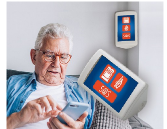
Système d'assistance AAL