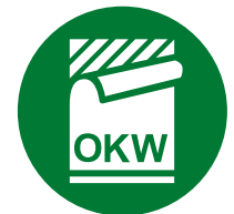
Étiquette, Films de décoration graphique