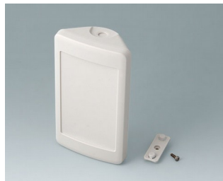
B4608207 SMART-CONTROL S, Vers. II ASA+PC (UL 94 V-0) gris blanc RAL 9002 142x81x46mm IP 55 opt., IP 40