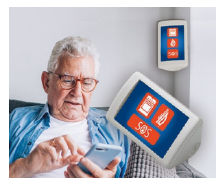
Système d'assistance AAL