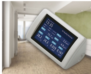
Appareil de mesure des aérosols