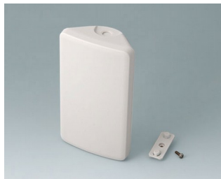
B4608107 SMART-CONTROL S, Vers. I ASA+PC (UL 94 V-0) gris blanc RAL 9002 142x81x46mm IP 55 opt., IP 40