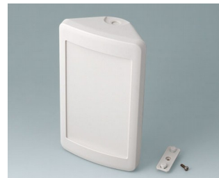
B4610207 SMART-CONTROL M, Vers. II ASA+PC (UL 94 V-0) gris blanc RAL 9002 173x101x59mm IP 55 opt., IP 40