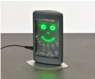
Appareil de mesure de l'air intérieur