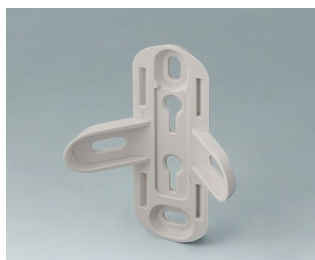
B4705907 Support mural ASA+PC (UL 94 V-0)