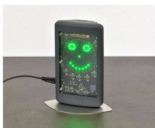
Appareil de mesure de l'air intérieur