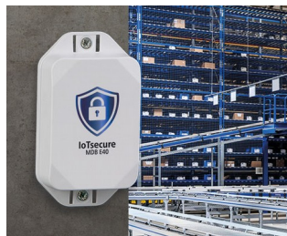
Autorisation d'accès des transpondeurs