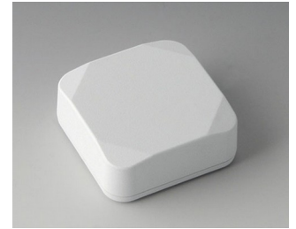
B1804217 MINI-DATA-BOX S50, haute ASA+PC (UL 94 V-0) blanc signalisation RAL 9016 50x50x20mm IP 65 opt., IP 40