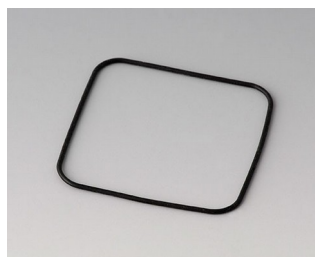
B1904101 Joint S50/SF50