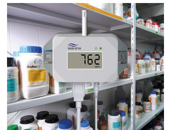
Détecteur de gaz pour substances dangereuses