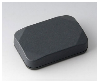
B1822118 MINI-DATA-BOX E40, plate ASA+PC (UL 94 V-0) gris anthracite RAL 7016 60x40x15mm IP 65 opt., IP 40