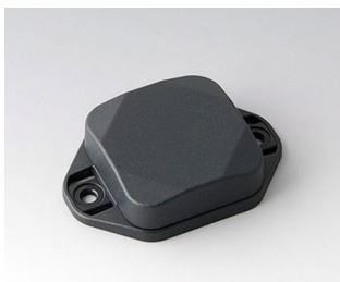
B1802128 MINI-DATA-BOX SF40, plate avec bride ASA+PC (UL 94 V-0) gris anthracite RAL 7016 40x40x15mm IP 65 opt., IP 40