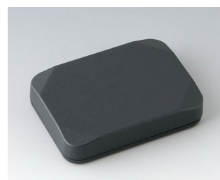
B1824118 MINI-DATA-BOX E50, plate ASA+PC (UL 94 V-0) gris anthracite RAL 7016 70x50x15mm IP 65 opt., IP 40