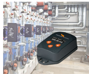
Contrôle de processus