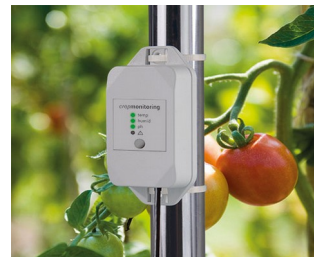
Enregistreur de données pour la gestion de l'usine