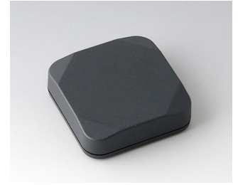
B1804118 MINI-DATA-BOX S50, plate ASA+PC (UL 94 V-0) gris anthracite RAL 7016 50x50x15mm IP 65 opt., IP 40