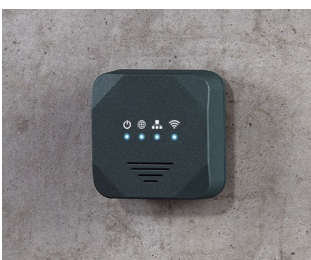
Point d'accès sans fil