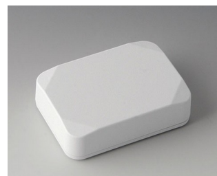
B1824217 MINI-DATA-BOX E50, haute ASA+PC (UL 94 V-0) blanc signalisation RAL 9016 70x50x20mm IP 65 opt., IP 40