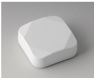
B1802117 MINI-DATA-BOX S40, plate ASA+PC (UL 94 V-0) blanc signalisation RAL 9016 40x40x15mm IP 65 opt., IP 40