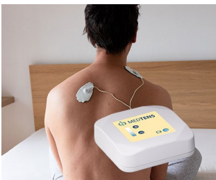
Appareil TENS pour le traitement de la douleur