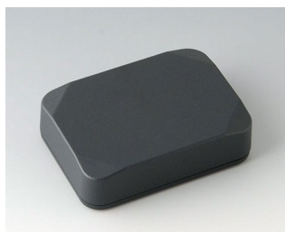
B1824218 MINI-DATA-BOX E50, haute ASA+PC (UL 94 V-0) gris anthracite RAL 7016 70x50x20mm IP 65 opt., IP 40