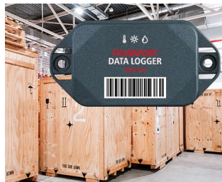
Enregistreur de données dans le transport