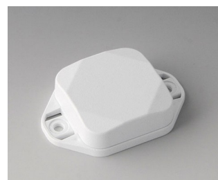
B1802127 MINI-DATA-BOX SF40, plate avec bride ASA+PC (UL 94 V-0) blanc signalisation RAL 9016 40x40x15mm IP 65 opt., IP 40