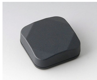
B1802118 MINI-DATA-BOX S40, plate ASA+PC (UL 94 V-0) gris anthracite RAL 7016 40x40x15mm IP 65 opt., IP 40