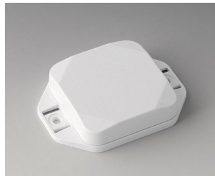
B1804127 MINI-DATA-BOX SF50, plate avec bride ASA+PC (UL 94 V-0) blanc signalisation RAL 9016 50x50x15mm IP 65 opt., IP 40