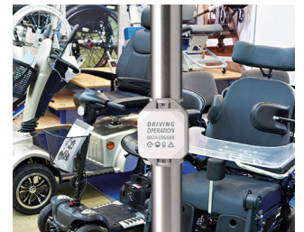
Enregistreur de données pour les opérations de conduite