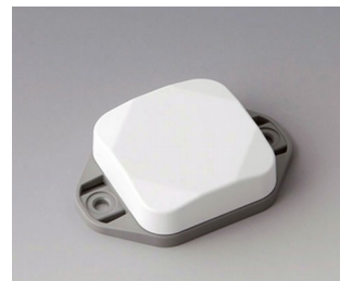
B1802126 MINI-DATA-BOX SF40, plate avec bride ASA+PC (UL 94 V-0) blanc signalisation RAL 9016 40x40x15mm IP 65 opt., IP 40