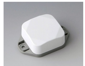
B1802226 MINI-DATA-BOX SF40, haute avec bride ASA+PC (UL 94 V-0) blanc signalisation RAL 9016 40x40x20mm IP 65 opt., IP 40