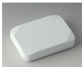
B1824117 MINI-DATA-BOX E50, plate ASA+PC (UL 94 V-0) blanc signalisation RAL 9016 70x50x15mm IP 65 opt., IP 40