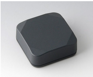
B1804218 MINI-DATA-BOX S50, haute ASA+PC (UL 94 V-0) gris anthracite RAL 7016 50x50x20mm IP 65 opt., IP 40