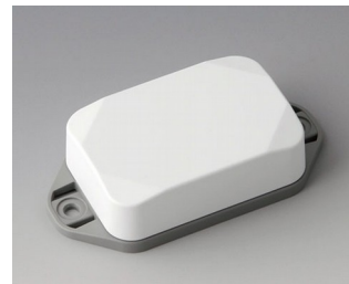
B1822226 MINI-DATA-BOX EF40, haute avec bride ASA+PC (UL 94 V-0) blanc signalisation RAL 9016 60x40x20mm IP 65 opt., IP 40