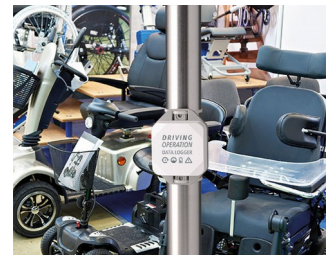
Enregistreur de données pour les opérations de conduite