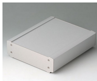
B3407023 SMART-TERMINAL 200 Aluminium AlMgSi 0,5 anodisé mat 204x170x50mm