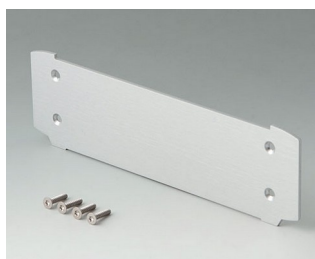
B3507025 Plaque de fermeture Aluminium anodisé mat