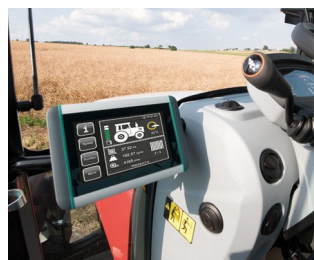
Terminal ISOBUS pour tracteurs et machines automotrices