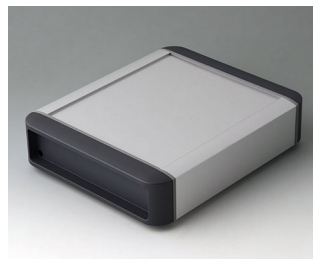
B3407012 SMART-TERMINAL 160 Aluminium AlMgSi 0,5 anodisé mat 202x170x50mm IP 54