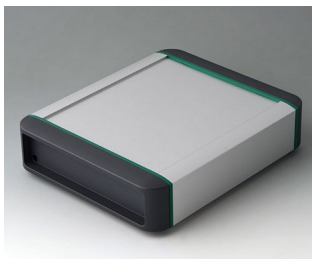
B3407011 SMART-TERMINAL 160 Aluminium AlMgSi 0,5 anodisé mat 202x170x50mm IP 54