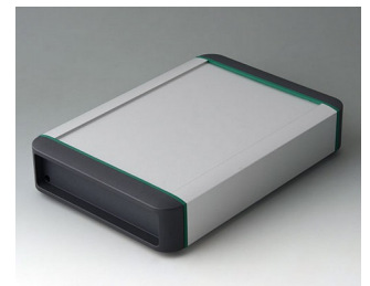
B3407021 SMART-TERMINAL 200 Aluminium AlMgSi 0,5 anodisé mat 242x170x50mm IP 54