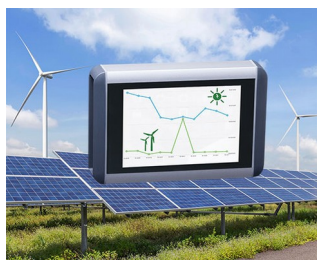
Système intelligent pour l'énergie éolienne et les systèmes solaires