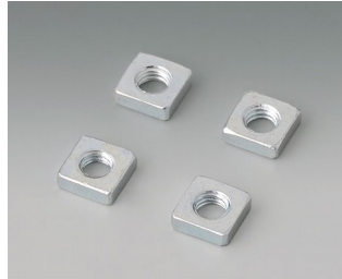
B3500001 Jeu d'écrous carrés M3 Acier