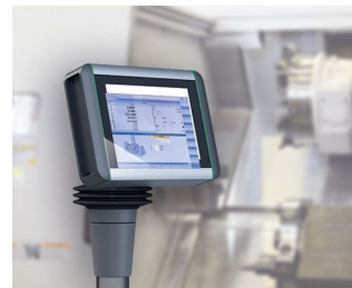
Panneau multi-touche pour le contrôle de la machine