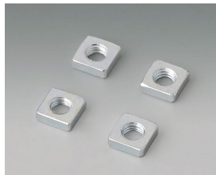
B3500001 Jeu d'écrous carrés M3 Acier