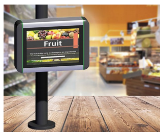
Borne d'information dans les points de vente