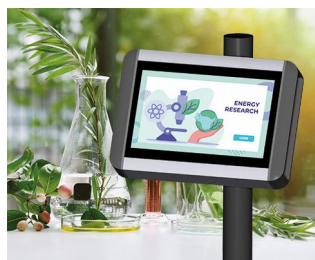
Terminal de recherche végétale