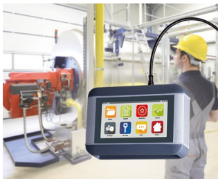
Appareil de diagnostic mobile pour machines