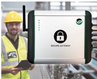
Industrial Secure Gateway