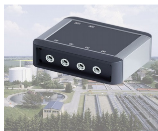
Contrôle de processus des usines