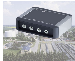
Contrôle de processus des usines