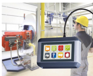
Appareil de diagnostic mobile pour machines