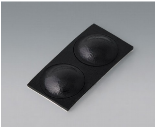
A9209229 Pieds anti-glissant 8,5 x 2,2 mm noir

Sous réserve de modifications techniques. © OKW Gehäusesysteme, Buchen/Allemagne.