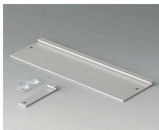
B3507020 Jeu de support mural Aluminium