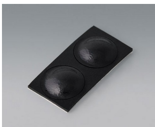
A9209229 Pieds anti-glissant 8,5 x 2,2 mm noir

Sous réserve de modifications techniques. © OKW Gehäusesysteme, Buchen/Allemagne.