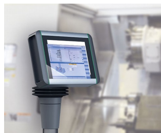
Panneau multi-touche pour le contrôle de la machine