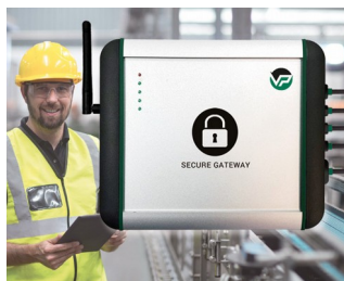
Industrial Secure Gateway