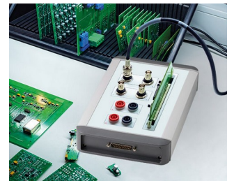
Contrôle de qualité des composants électroniques