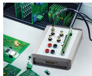
Contrôle de qualité des composants électroniques