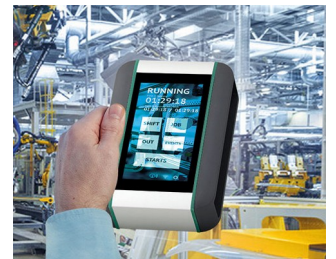
Système de surveillance en temps réel de la machine