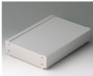
B3407033 SMART-TERMINAL 240 Aluminium AlMgSi 0,5 anodisé mat 244x170x50mm