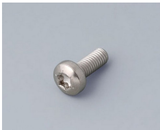
A0330080 Vis M3 x 8 mm (T10) Acier inoxydable