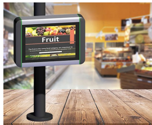
Borne d'information dans les points de vente