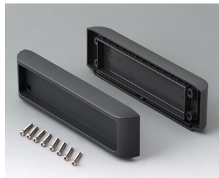
B3507011 Jeu de couvercles ASA+PC (UL 94 V-0) lava