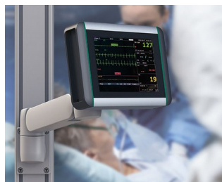
Moniteur de surveillance des signes vitaux