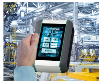
Système de surveillance en temps réel de la machine