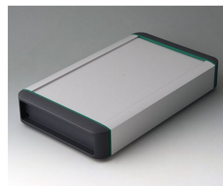
B3407031 SMART-TERMINAL 240 Aluminium AlMgSi 0,5 anodisé mat 282x170x50mm IP 54