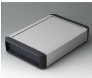
B3407022 SMART-TERMINAL 200 Aluminium AlMgSi 0,5 anodisé mat 242x170x50mm IP 54