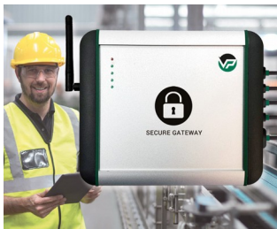
Industrial Secure Gateway