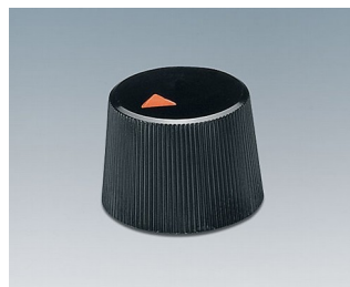
A1316240 BOUTON, à fixation latérale par vis ABS (UL 94 HB) noir RAL 9005 16,4x12,3mm 4mm