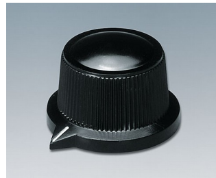
A1319560 BOUTON, à fixation latérale par vis PF noir RAL 9005 29x20,1mm 6mm