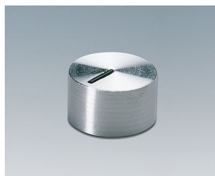
A1412441 BOUTON, à fixation latérale par vis PC brillant 12x7,2mm 4mm