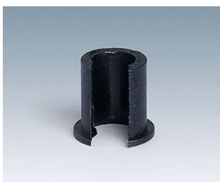
A1300040 Réducteur ABS (UL 94 HB) noir RAL 9005 7,4x7mm 4mm

Sous réserve de modifications techniques. © OKW Gehäusesysteme, Buchen/Allemagne.