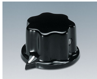
A1321060 BOUTON, à fixation latérale par vis PF (UL 94 V-0) noir RAL 9005 31x20mm 6mm