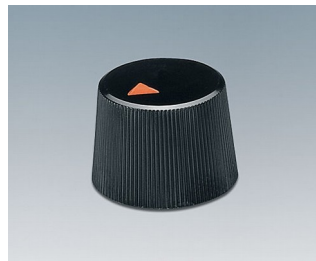
A1316240 BOUTON, à fixation latérale par vis ABS (UL 94 HB) noir RAL 9005 16,4x12,3mm 4mm