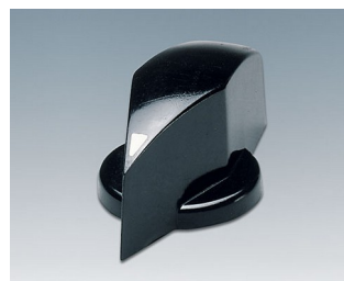
A1324860 BOUTON, à fixation latérale par vis PF noir RAL 9005 25x20mm 6mm