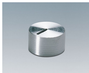
A1412461 BOUTON, à fixation latérale par vis PC brillant 12x7,1mm 6mm