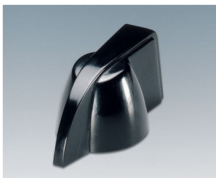
A1319860 BOUTON, à fixation latérale par vis PF noir RAL 9005 20,3x18mm 6mm