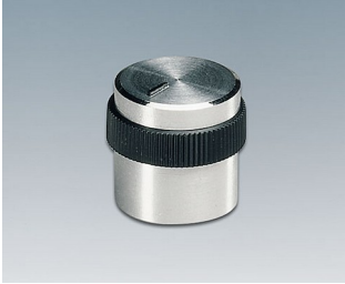
A1416469 BOUTON, à fixation latérale par vis ABS (UL 94 HB) brillant 15,9x15,2mm 6mm