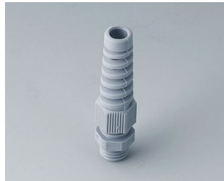
C2312518 Passe-câble à vis M12x1,5 PA gris argent RAL 7001