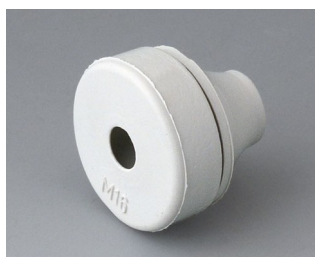
C2316137 Passe-câble EPDM gris clair RAL 7035