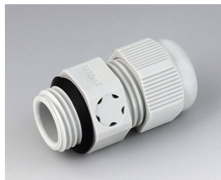
C2316917 Passe-câble à vis M16x1,5, compensation de pression PA gris clair RAL 7035