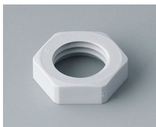
C2312117 Contre-écrou M12x1,5 PA gris clair RAL 7035