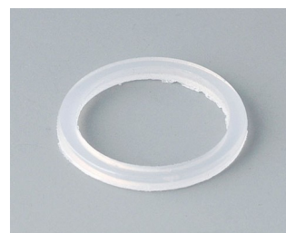
C2316126 Joint d'étanchéité M16x1,5 PE teinte neutre