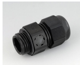
C2316919 Passe-câble à vis M16x1,5, compensation de pression PA noir RAL 9005