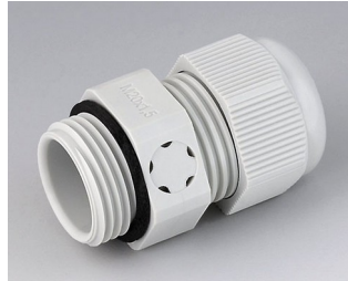
C2320917 Passe-câble à vis M20x1,5, compensation de pression PA gris clair RAL 7035 IP 68