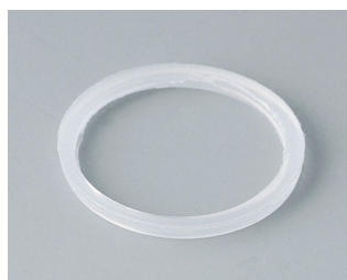
C2320126 Joint d'étanchéité M20x1,5 PE teinte neutre

Sous réserve de modifications techniques. © OKW Gehäusesysteme, Buchen/Allemagne.