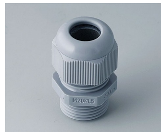
C2320418 Passe-câble à vis M20x1,5 PA gris argent RAL 7001