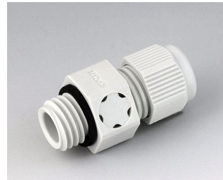
C2312917 Passe-câble à vis M12x1,5, compensation de pression PA gris clair RAL 7035