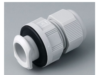
C2320717 Passe-câble à vis, M20, quick fix PA gris clair RAL 7035