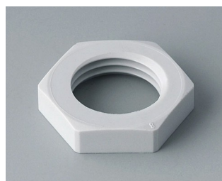
C2316117 Contre-écrou M16x1,5 PA gris clair RAL 7035