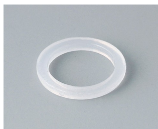
C2312126 Joint d'étanchéité M12x1,5 PE teinte neutre