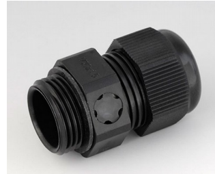
C2320919 Passe-câble à vis M20x1,5, compensation de pression PA noir RAL 9005 IP 68