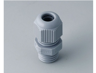
C2312418 Passe-câble à vis M12x1,5 PA gris argent RAL 7001