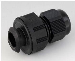
C2316719 Passe-câble à vis, M16, quick fix PA noir RAL 9005