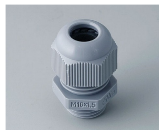
C2316418 Passe-câble à vis M16x1,5 PA gris argent RAL 7001