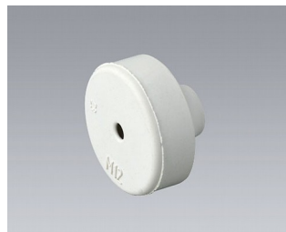
C2312137 Passe-câble EPDM gris clair RAL 7035