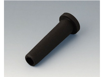
C2353849 Passe-câble souple Ø 5.3 noir