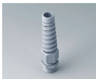
C2320518 Passe-câble à vis M20x1,5 PA gris argent RAL 7001