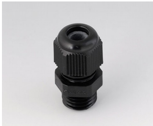
C2312419 Passe-câble à vis M12x1,5 PA noir RAL 9005