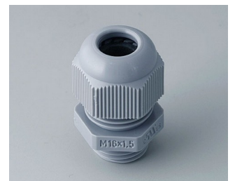
C2316418 Passe-câble à vis M16x1,5 PA gris argent RAL 7001