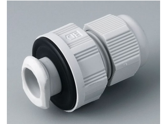
C2316717 Passe-câble à vis, M16, quick fix PA gris clair RAL 7035