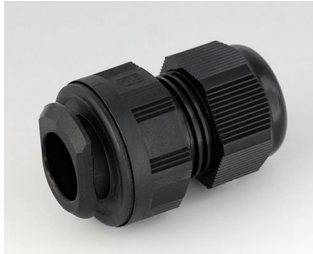
C2320719 Passe-câble à vis, M20, quick fix PA noir RAL 9005 IP 68