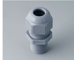
C2316618 Passe câble à vis M16x1,5 PA gris argent RAL 7001