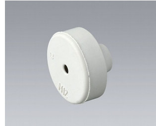
C2312137 Passe-câble EPDM gris clair RAL 7035