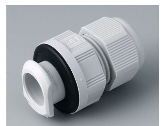
C2320717 Passe-câble à vis, M20, quick fix PA gris clair RAL 7035