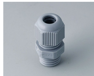
C2312418 Passe-câble à vis M12x1,5 PA gris argent RAL 7001