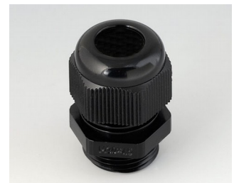
C2320419 Passe-câble à vis M20x1,5 PA noir RAL 9005