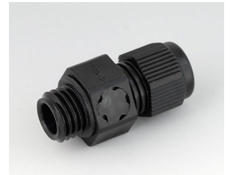
C2312919 Passe-câble à vis M12x1,5, compensation de pression PA noir RAL 9005