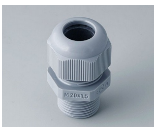
C2320428 Passe-câble à vis M20x1,5 PA gris argent RAL 7001