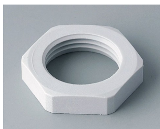
C2320117 Contre-écrou M20x1,5 PA gris clair RAL 7035