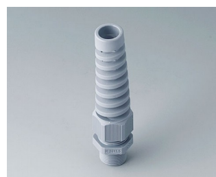
C2320528 Passe-câble à vis M20x1,5 PA gris argent RAL 7001