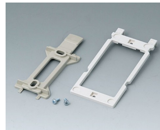
B1350048 Jeu de support mural ABS (UL 94 HB) gris silex RAL 7032