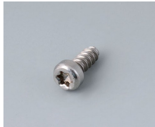
A0325060 Vis autotaraudeuse 2,5 x 6 mm (T8) Acier inoxydable