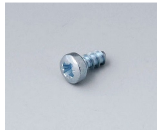
A0306031 Vis autotaraudeuses 3 x 6 mm (PZ1)