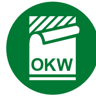
Étiquette, Films de décoration graphique