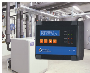
Gestionnaire de température