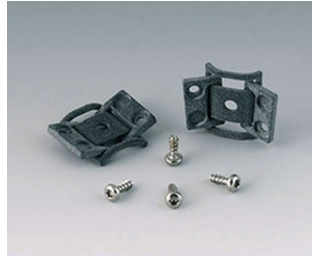
C8100360 Jeu de charnières