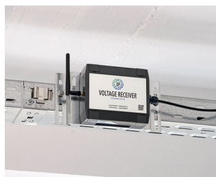
Récepteur de tension