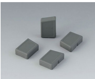
C8100188 Jeu de pieds de boîtier SEBS (TPE) volcan

Sous réserve de modifications techniques. © OKW Gehäusesysteme, Buchen/Allemagne.