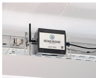
Récepteur de tension