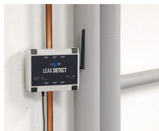
Détecteur de fuite