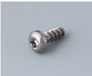
A0308132 Vis autotaraudeuse 3 x 8 mm (T10) Acier inoxydable