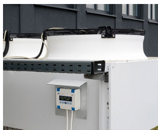
Commande de chauffage/climatisation/ventilation