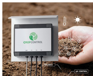
Smart Farming - système pour des mesures à long terme