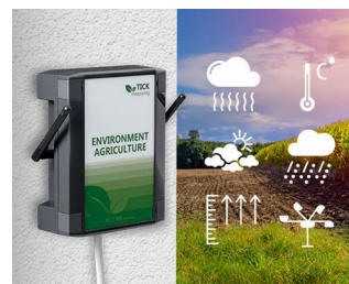
Station météo en agriculture