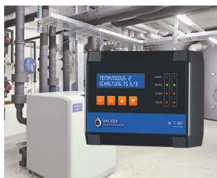
Gestionnaire de température