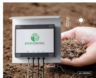
Smart Farming - système pour des mesures à long terme