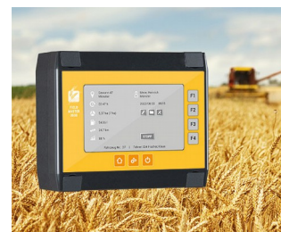
Enregistrement des données pour les moissonneuses