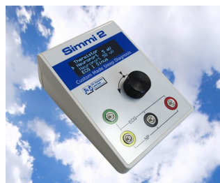
Simulateur de signal biologique