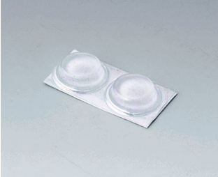
A9212330 Pieds anti-glissant 12 x 3,5 mm transparent

Sous réserve de modifications techniques. © OKW Gehäusesysteme, Buchen/Allemagne.