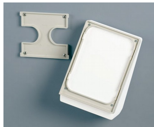
B4156307 Jeu de support mural M gris blanc RAL 9002