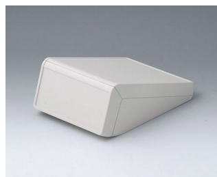
B4054127 UNITEC S, 1,4/0,6 ABS (UL 94 HB) gris blanc RAL 9002 125x177x69mm IP 40