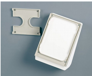
B4154307 Jeu de support mural S gris blanc RAL 9002