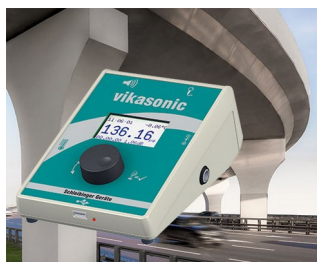
Appareil de mesure à ultrasons