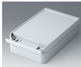
C6013221 SMART-BOX 130 BREIT ASA+PC (UL 94 V-0) lichtgrau RAL 7035 220x130x60mm IP 66