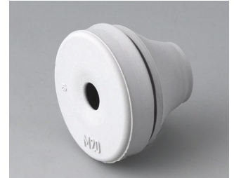
C2320137 Kabeldurchführung EPDM lichtgrau RAL 7035 IP 67