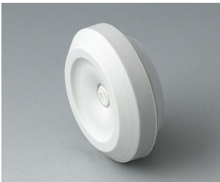
C2320147 Kabeldurchführung TPE lichtgrau RAL 7035 IP 67