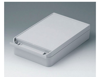
C6017281 SMART-BOX 170 BREIT ASA+PC (UL 94 V-0) lichtgrau RAL 7035 280x170x60mm IP 65