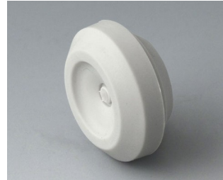
C2316147 Kabeldurchführung TPE lichtgrau RAL 7035 IP 67