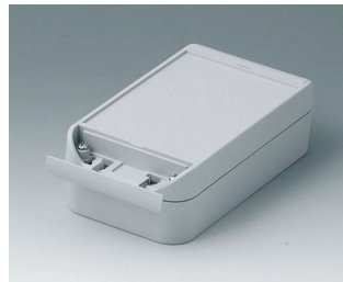
C6009161 SMART-BOX 90 BREIT ASA+PC (UL 94 V-0) lichtgrau RAL 7035 160x90x50mm IP 66