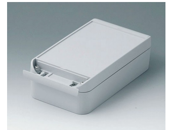
C6011201 SMART-BOX 110 BREIT ASA+PC (UL 94 V-0) lichtgrau RAL 7035 200x110x60mm IP 66