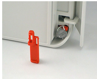
C6100006 Plombierstift PA 6 rot