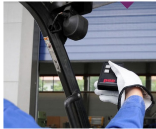
IR-Fernbedienung für raue Umgebung