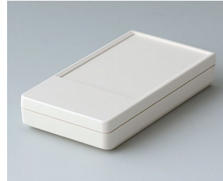
A9070117 DATEC-POCKET-BOX S ABS (UL 94 HB) grauweiß RAL 9002 85x46x16mm IP 54