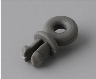
A9100001 Ringöse PA 6 vulkan