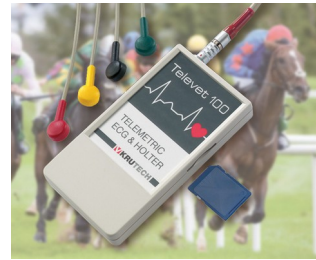
Telemetrisches EKG System für die Veterinärmedizin