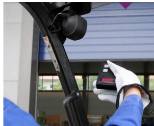
IR-Fernbedienung für raue Umgebung