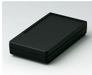
A9070219 DATEC-POCKET-BOX S PMMA (IR) (UL 94 HB) schwarz RAL 9005 85x46x16mm IP 54