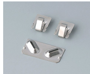
A9190003 Kontaktfedern-Set, 2xN/2xAA/2xAAA Stahl vernickelt