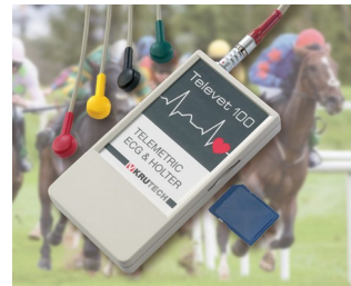
Telemetrisches EKG System für die Veterinärmedizin