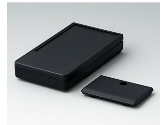
A9071219 DATEC-POCKET-BOX M PMMA (IR) (UL 94 HB) schwarz RAL 9005 105x58x18,5mm IP 54