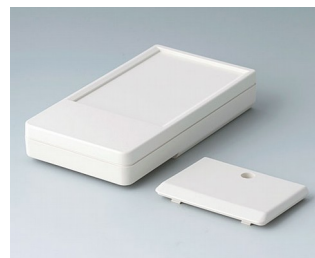
A9072117 DATEC-POCKET-BOX L ABS (UL 94 HB) grauweiß RAL 9002 120x65x22mm IP 54