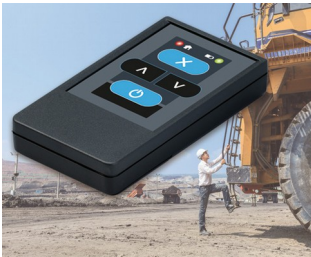
Funksender für Maschinen