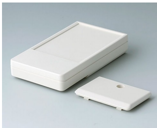
A9071117 DATEC-POCKET-BOX M ABS (UL 94 HB) grauweiß RAL 9002 105x58x18,5mm IP 54