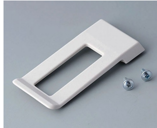
A9172107 Ansteckclip ABS (UL 94 HB) grauweiß RAL 9002 62x30mm