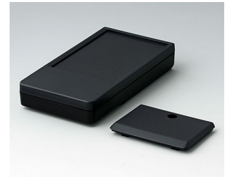
A9072219 DATEC-POCKET-BOX L PMMA (IR) (UL 94 HB) schwarz RAL 9005 120x65x22mm IP 54