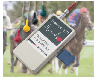
Telemetrisches EKG System für die Veterinärmedizin