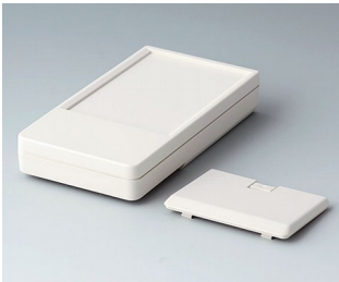
A9072127 DATEC-POCKET-BOX L ABS (UL 94 HB) grauweiß RAL 9002 120x65x22mm IP 41