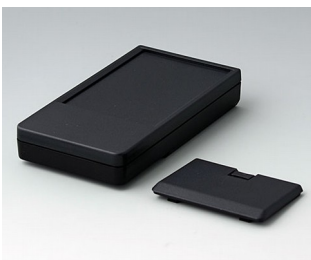
A9072229 DATEC-POCKET-BOX L PMMA (IR) (UL 94 HB) schwarz RAL 9005 120x65x22mm IP 41