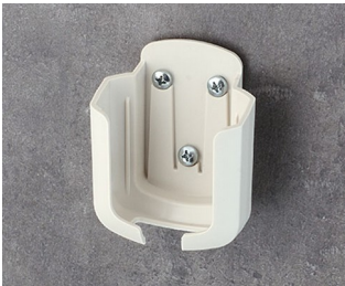
B2931507 Halter M ASA+PC (UL 94 V-0) grauweiß RAL 9002