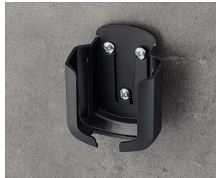
B2931509 Halter M ASA+PC (UL 94 V-0) schwarz RAL 9005