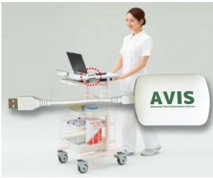
Receiver zur Datenübertragung in elektronische Krankenakte