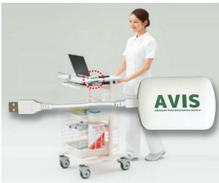
Receiver zur Datenübertragung in elektronische Krankenakte