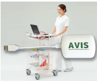
Receiver zur Datenübertragung in elektronische Krankenakte