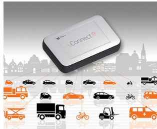
Modul für smarte Mobilitätsanwendungen