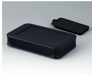
A9052229 SOFT-CASE L PMMA (IR) (UL 94 HB) schwarz RAL 9005 73x117x24mm IP 40