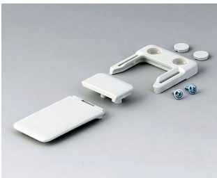
A9152047 Combi-Clip ABS (UL 94 HB) grauweiß RAL 9002 45x27mm