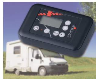
Fernbedienung für AutoSat Satellitenempfangsanlage