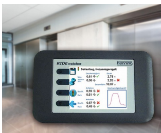
RIDEwatcher Multimeter für Fahrprofile