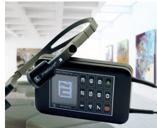
Multimedia-Audioguide für Museen