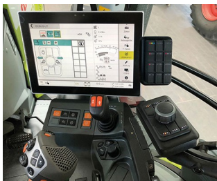
Digitaler Joystick für ISO-Bus-Maschinen