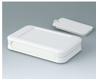
A9052127 SOFT-CASE L ABS (UL 94 HB) grauweiß RAL 9002 73x117x24mm IP 40