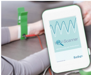
HRV-Scanner zur Analyse des vegetativen Nervensystems