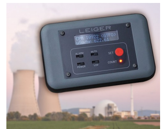
Geigerzähler mit Protokollfunktion