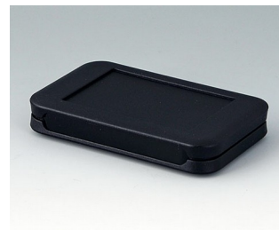
A9050209 SOFT-CASE S PMMA (IR) (UL 94 HB) schwarz RAL 9005 51x82x14mm IP 54 opt., IP 40