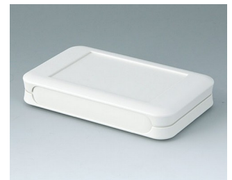
A9051107 SOFT-CASE M ABS (UL 94 HB) grauweiß RAL 9002 65x105x19mm IP 54 opt., IP 40