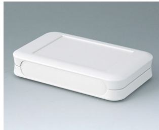
A9052107 SOFT-CASE L ABS (UL 94 HB) grauweiß RAL 9002 73x117x24mm IP 54 opt., IP 40