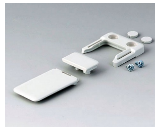
A9152047 Combi-Clip ABS (UL 94 HB) grauweiß RAL 9002 45x27mm