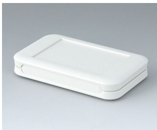
A9050107 SOFT-CASE S ABS (UL 94 HB) grauweiß RAL 9002 51x82x14mm IP 54 opt., IP 40