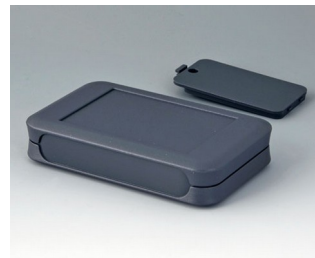
A9052128 SOFT-CASE L ABS (UL 94 HB) lava 73x117x24mm IP 40