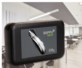
Sensor zur Messung der Kohlendioxidkonzentration