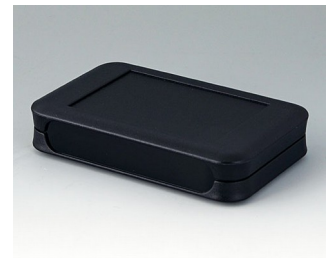
A9052209 SOFT-CASE L PMMA (IR) (UL 94 HB) schwarz RAL 9005 73x117x24mm IP 54 opt., IP 40