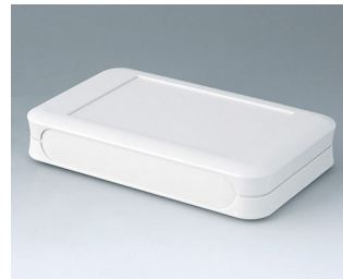
A9053107 SOFT-CASE XL ABS (UL 94 HB) grauweiß RAL 9002 92x150x28mm IP 40