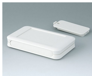
A9051117 SOFT-CASE M ABS (UL 94 HB) grauweiß RAL 9002 65x105x19mm IP 40