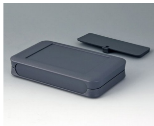
A9053118 SOFT-CASE XL ABS (UL 94 HB) lava 92x150x28mm IP 40