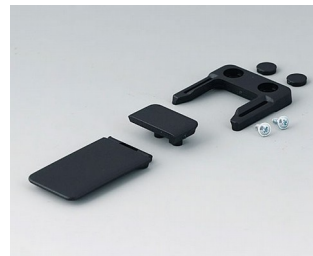
A9152049 Combi-Clip ABS (UL 94 HB) schwarz RAL 9005 45x27mm