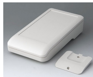
A9007217 DATEC-COMPACT L ASA+PC (UL 94 V-0) grauweiß RAL 9002 206x110x47mm IP 41