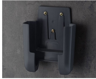
A9107628 Halter L ASA+PC (UL 94 V-0) lava