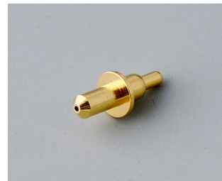
A9193031 Federkontakt vergoldet