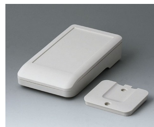
A9005217 DATEC-COMPACT S ASA+PC (UL 94 V-0) grauweiß RAL 9002 136x74x32mm IP 41