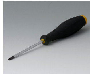
A0399T08 Torx Schraubendreher T8