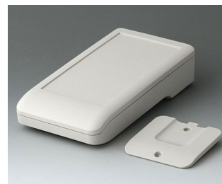
A9006217 DATEC-COMPACT M ASA+PC (UL 94 V-0) grauweiß RAL 9002 172x92x39mm IP 41