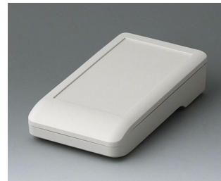
A9005117 DATEC-COMPACT S ASA+PC (UL 94 V-0) grauweiß RAL 9002 136x74x32mm IP 41