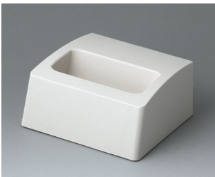
A9105507 Sockel S ASA+PC (UL 94 V-0) grauweiß RAL 9002