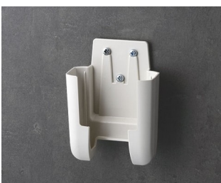
A9105627 Halter S ASA+PC (UL 94 V-0) grauweiß RAL 9002