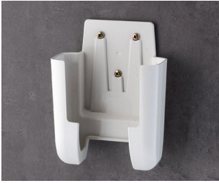
A9107627 Halter L ASA+PC (UL 94 V-0) grauweiß RAL 9002