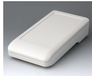
A9007117 DATEC-COMPACT L ASA+PC (UL 94 V-0) grauweiß RAL 9002 206x110x47mm IP 41