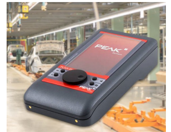
Mobiles Diagnosegerät für CAN- und CAN-FD-Busse