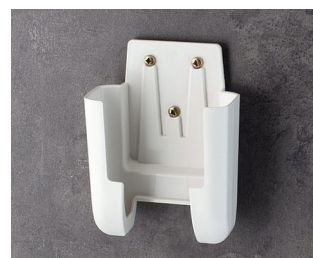
A9106627 Halter M ASA+PC (UL 94 V-0) grauweiß RAL 9002