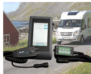
System zur Feuchtigkeitskontrolle an Freizeit-Fahrzeugen