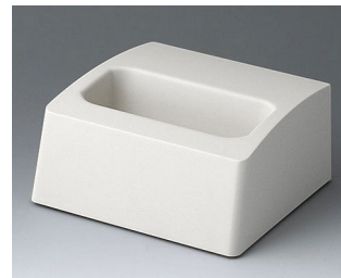
A9106507 Sockel M ASA+PC (UL 94 V-0) grauweiß RAL 9002