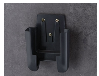
A9106628 Halter M ASA+PC (UL 94 V-0) lava