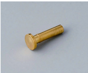
A9193030 Kontaktstift vergoldet