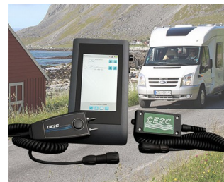
System zur Feuchtigkeitskontrolle an Freizeit-Fahrzeugen