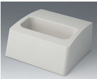
A9107507 Sockel L ASA+PC (UL 94 V-0) grauweiß RAL 9002