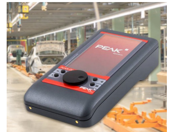
Mobiles Diagnosegerät für CAN- und CAN-FD-Busse