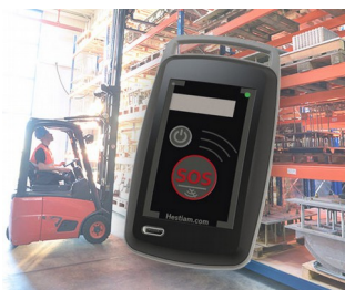
Mobile Sicherheitslösung für Arbeiter