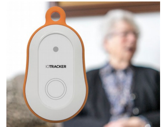
LoRa GPS-Tracker mit Alarmknopf