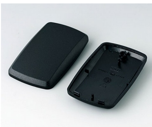
B9004856 Unter- und Oberteil EM PMMA (IR) (UL 94 HB) schwarz RAL 9005 68x42x18mm