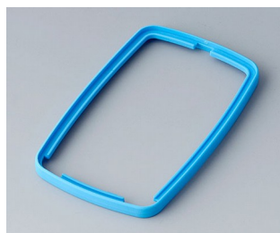
B9006785 Zwischenring EL TPE blau