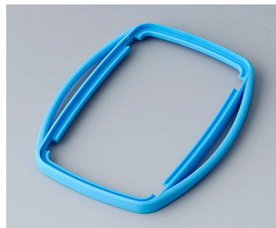
B9006755 Zwischenring EL TPE blau