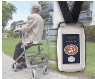
Funksender für Patienten-Notrufsystem