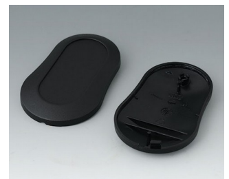
B9004906 Unter- und Oberteil DM PMMA (IR) (UL 94 HB) schwarz RAL 9005 70x44x16mm