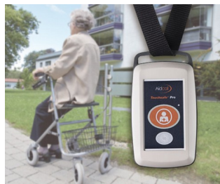
Funksender für Patienten-Notrufsystem