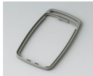
B9004708 Zwischenring EM TPE vulkan