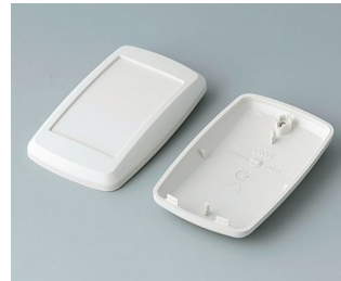
B9004807 Unter- und Oberteil EM ABS (UL 94 HB) grauweiß RAL 9002 68x42x18mm