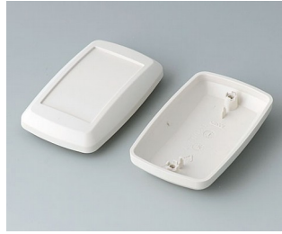
B9006827 Unter- und Oberteil EL ABS (UL 94 HB) grauweiß RAL 9002 78x48x26mm