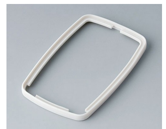
B9006787 Zwischenring EL SEBS (TPE) grauweiß RAL 9002