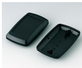
B9006816 Unter- und Oberteil EL PMMA (IR) (UL 94 HB) schwarz RAL 9005 78x48x24mm