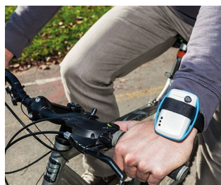
Mobile Überwachung der Luftqualität