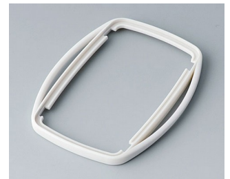
B9006757 Zwischenring EL SEBS (TPE) grauweiß RAL 9002