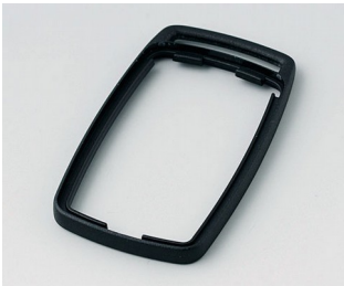
B9002706 Zwischenring ES PMMA (IR) (UL 94 HB) schwarz RAL 9005