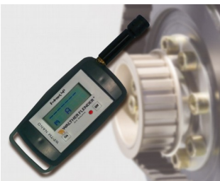
Tension-Meter zur Messung der Riemenvorspannung