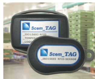
RFID Sensortransponder und Datenlogger