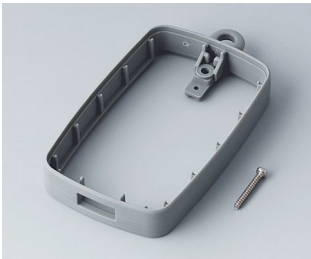
B9004798 Zwischenring EM, USB Typ A SEBS (TPE) vulkan