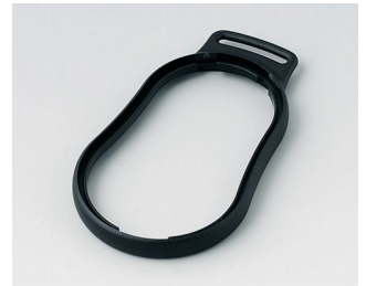
B9004309 Zwischenring DM ABS (UL 94 HB) schwarz RAL 9005