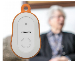
LoRa GPS-Tracker mit Alarmknopf