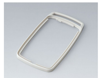
B9006707 Zwischenring EL SEBS (TPE) grauweiß RAL 9002