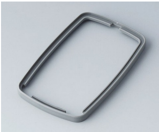
B9006788 Zwischenring EL TPE vulkan