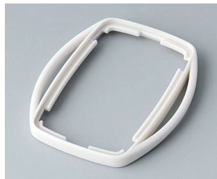
B9002757 Zwischenring ES TPE grauweiß RAL 9002