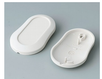
B9002907 Unter- und Oberteil DS ABS (UL 94 HB) grauweiß RAL 9002 51x32x13mm