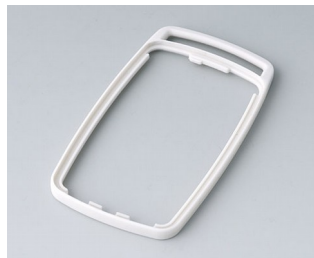
B9004707 Zwischenring EM TPE grauweiß RAL 9002