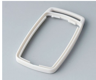
B9002707 Zwischenring ES TPE grauweiß RAL 9002