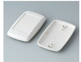
B9006807 Unter- und Oberteil EL ABS (UL 94 HB) grauweiß RAL 9002 78x48x20mm