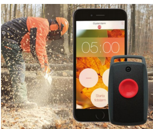
Persönlicher Alarm auf dem Smartphone