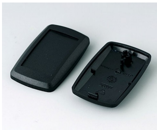
B9002806 Unter- und Oberteil ES PMMA (IR) (UL 94 HB) schwarz RAL 9005 52x32x15mm