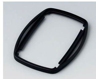
B9006756 Zwischenring EL PMMA (IR) (UL 94 HB) schwarz RAL 9005