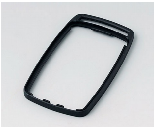
B9004706 Zwischenring EM PMMA (IR) (UL 94 HB) schwarz RAL 9005