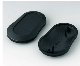
B9006906 Unter- und Oberteil DL PMMA (IR) (UL 94 HB) schwarz RAL 9005 84x53x19mm