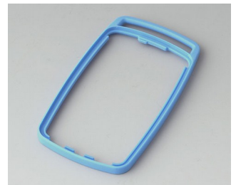
B9004705 Zwischenring EM TPE blau