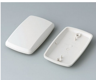
B9006857 Unter- und Oberteil EL ABS (UL 94 HB) grauweiß RAL 9002 78x48x20mm