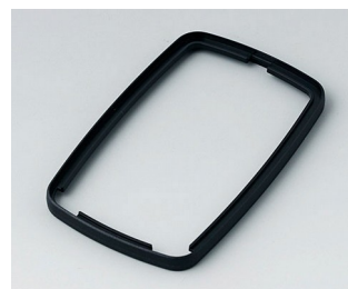
B9006786 Zwischenring EL PMMA (IR) (UL 94 HB) schwarz RAL 9005