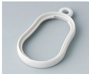
B9002357 Zwischenring DS SEBS (TPE) grauweiß RAL 9002