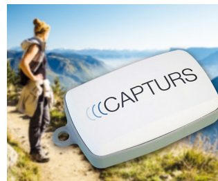
GPS-Tracking in Echtzeit