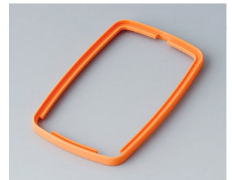
B9006783 Zwischenring EL TPE orange