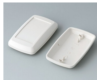
B9006817 Unter- und Oberteil EL ABS (UL 94 HB) grauweiß RAL 9002 78x48x24mm