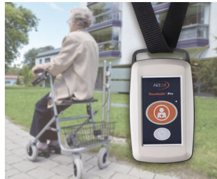
Funksender für Patienten-Notrufsystem