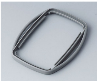
B9006758 Zwischenring EL TPE vulkan