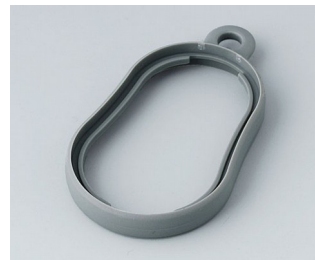
B9002358 Zwischenring DS TPE vulkan