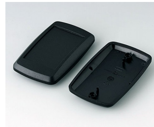
B9006806 Unter- und Oberteil EL PMMA (IR) (UL 94 HB) schwarz RAL 9005 78x48x20mm