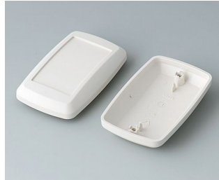
B9006827 Unter- und Oberteil EL ABS (UL 94 HB) grauweiß RAL 9002 78x48x26mm