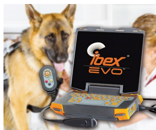
Portables Ultraschallgerät für die Veterinärmedizin