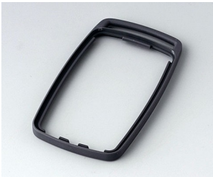
B9004702 Zwischenring EM TPE lava