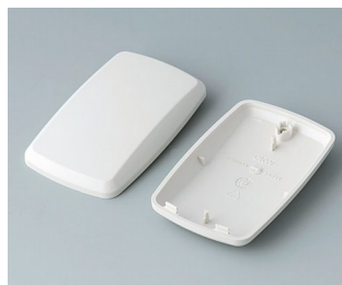
B9004857 Unter- und Oberteil EM ABS (UL 94 HB) grauweiß RAL 9002 68x42x18mm