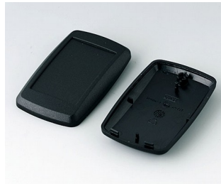
B9004806 Unter- und Oberteil EM PMMA (IR) (UL 94 HB) schwarz RAL 9005 68x42x18mm