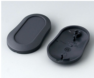
B9002908 Unter- und Oberteil DS ABS (UL 94 HB) lava 51x32x13mm