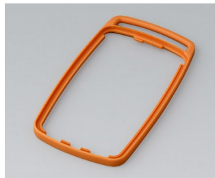
B9004703 Zwischenring EM TPE orange