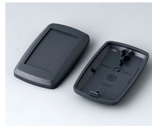
B9002808 Unter- und Oberteil ES ABS (UL 94 HB) lava 52x32x15mm