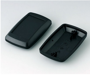
B9006826 Unter- und Oberteil EL PMMA (IR) (UL 94 HB) schwarz RAL 9005 78x48x26mm