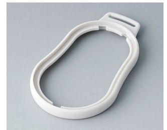
B9006307 Zwischenring DL SEBS (TPE) grauweiß RAL 9002