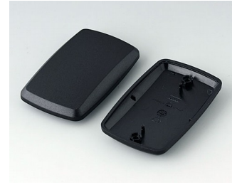
B9006856 Unter- und Oberteil EL PMMA (IR) (UL 94 HB) schwarz RAL 9005 78x48x20mm