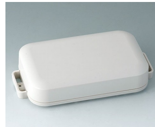
C3208107 EASYTEC 150 ASA+PC (UL 94 V-0) grauweiß RAL 9002 172x93x36mm IP 65 opt., IP 40