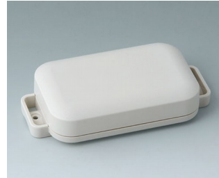
C3206107 EASYTEC 100 ASA+PC (UL 94 V-0) grauweiß RAL 9002 121x62x26mm IP 65 opt., IP 40