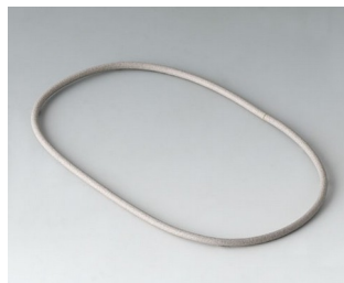
A9502030 Dichtung 100