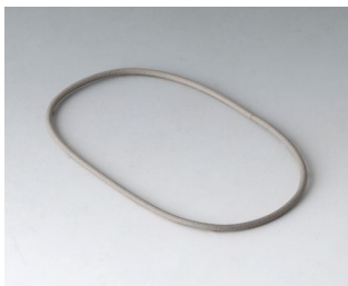
A9500030 Dichtung 80