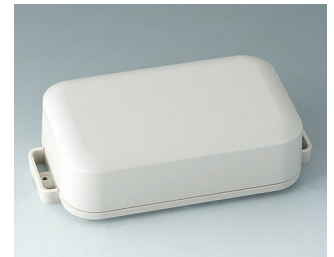
C3208207 EASYTEC 150 ASA+PC (UL 94 V-0) grauweiß RAL 9002 172x93x46mm IP 65 opt., IP 40