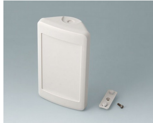
B4608207 SMART-CONTROL S, Ausf. II ASA+PC (UL 94 V-0) grauweiß RAL 9002 142x81x46mm IP 55 opt., IP 40