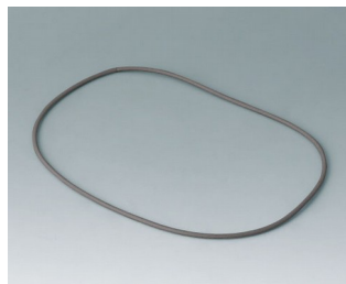
B4710920 Dichtung M