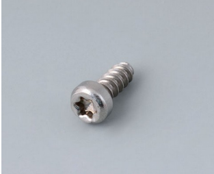
A0325060 Selbstformende Schraube 2,5 x 6 mm (T8) Edelstahl