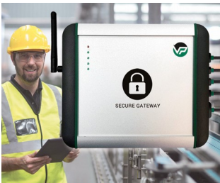
Industrial Secure Gateway