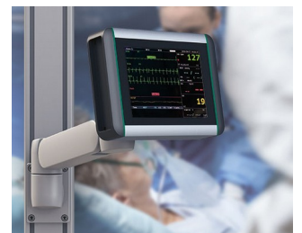
Überwachungsmonitor für Vitalfunktionen