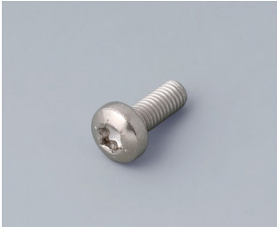
A0330080 Schraube M3 x 8 mm (T10) Edelstahl