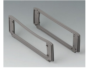
B3507017 Designdichtungs-Set, vulkan TPV 50A vulkan