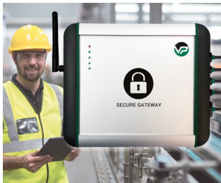
Industrial Secure Gateway