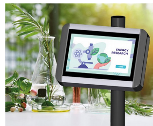
Terminal für Pflanzenforschung