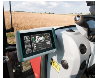
ISOBUS-Terminal für Traktoren und selbstfahrende Arbeitsmaschinen