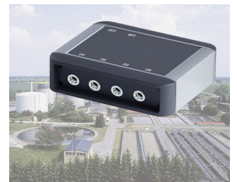
Prozessüberwachung von Anlagen