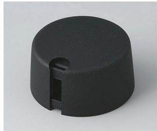
A1031649 TOP-KNOBS 31 PA 6 nero 31x16mm