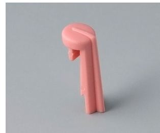
A1105003 Skala PA 6 (UL 94 HB) korall