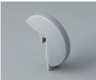
A1103007 Disk PA 6 (UL 94 HB) mineral