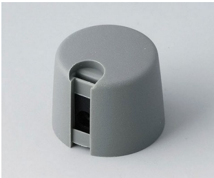
A1020648 TOP-KNOBS 20 PA 6 vulkan 20x16mm