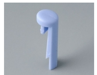
A1101006 Pin PA 6 (UL 94 HB) sky