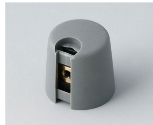
A1016068 TOP-KNOBS 16 PA 6 vulkan 16x16mm 6mm