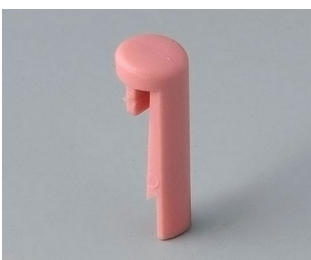
A1101003 Pin PA 6 (UL 94 HB) korall