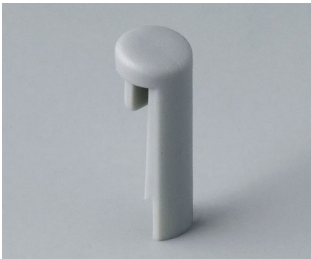
A1101007 Pin PA 6 (UL 94 HB) mineral