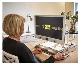
Bedienknöpfe für Bildschirmlesegerät