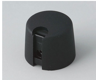
A1020649 TOP-KNOBS 20 PA 6 nero 20x16mm