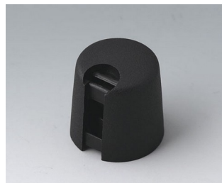
A1016649 TOP-KNOBS 16 PA 6 nero 16x16mm