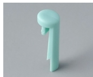
A1101005 Pin PA 6 (UL 94 HB) lagun