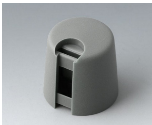
A1016648 TOP-KNOBS 16 PA 6 vulkan 16x16mm