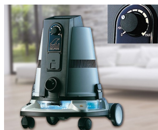
Bedienelement für einen Bodestaubsauger