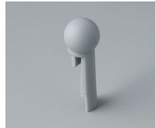
A1102007 Globe PA 6 (UL 94 HB) mineral