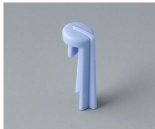
A1105006 Skala PA 6 (UL 94 HB) sky