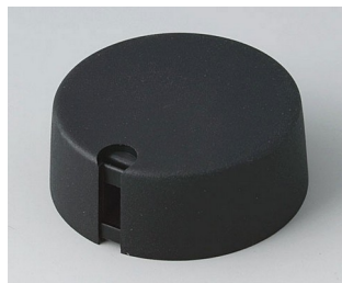
A1040649 TOP-KNOBS 40 PA 6 nero 40x16mm