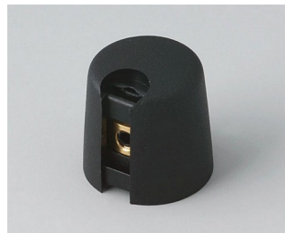
A1016049 TOP-KNOBS 16 PA 6 nero 16x16mm 4mm