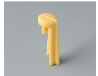
A1105004 Skala PA 6 (UL 94 HB) beach