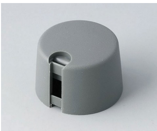
A1024648 TOP-KNOBS 24 PA 6 vulkan 24x16mm