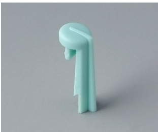
A1105005 Skala PA 6 (UL 94 HB) lagun