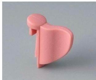
A1104003 Wing PA 6 (UL 94 HB) korall