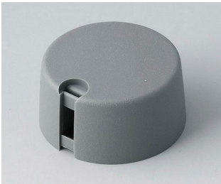
A1031648 TOP-KNOBS 31 PA 6 vulkan 31x16mm