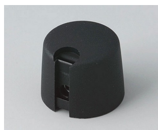
A1020069 TOP-KNOBS 20 PA 6 nero 20x16mm 6mm