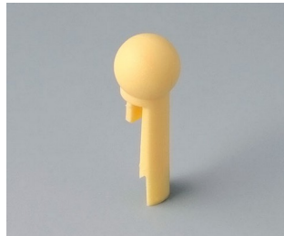
A1102004 Globe PA 6 (UL 94 HB) beach