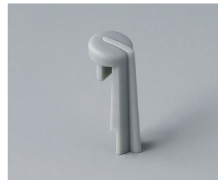
A1105007 Skala PA 6 (UL 94 HB) mineral