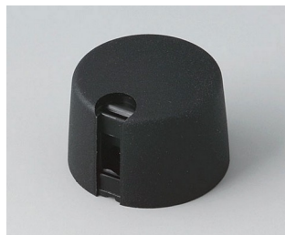
A1024649 TOP-KNOBS 24 PA 6 nero 24x16mm