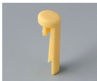
A1101004 Pin PA 6 (UL 94 HB) beach