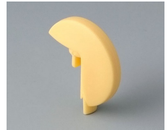
A1103004 Disk PA 6 (UL 94 HB) beach