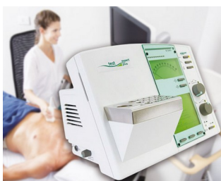
Bedienelement für ein Diagnose-Gerät