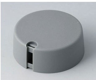
A1040648 TOP-KNOBS 40 PA 6 vulkan 40x16mm