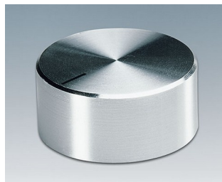
A1438461 DREHKNOPF, mit seittl. Schraubbefestigung ABS (UL 94 HB) glänzend 37,8x15,9mm 6mm