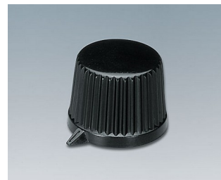
A1613560 DREHKNOPF, mit seittl. Schraubbefestigung ABS (UL 94 HB) schwarz RAL 9005 19,9x15,5mm 6mm