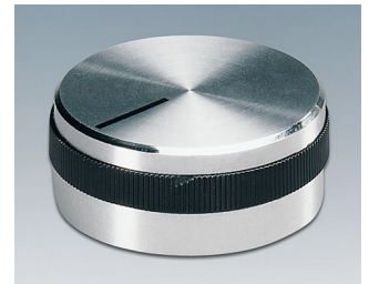
A1432469 DREHKNOPF, mit seittl. Schraubbefestigung ABS (UL 94 HB) glänzend 31,9x14mm 6mm