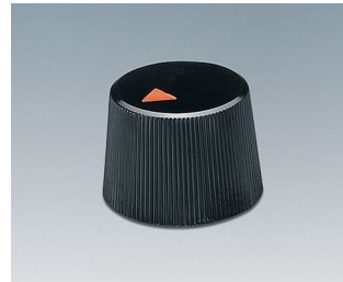
A1316240 DREHKNOPF, mit seidl. Schraubbefestigung ABS (UL 94 HB) schwarz RAL 9005 16,4x12,3mm 4mm