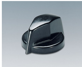
A1311860 DREHKNOPF, mit seidl. Schraubbefestigung PF (UL 94 V-0) schwarz RAL 9005 18,8x12,5mm 6mm