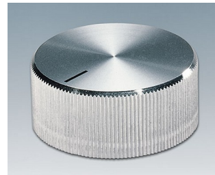
A1432261 DREHKNOPF, mit seittl. Schraubbefestigung ABS (UL 94 HB) glänzend 32,8x14,4mm 6mm