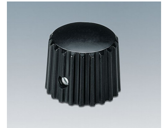
A1321160 DREHKNOPF, mit seittl. Schraubbefestigung ABS (UL 94 HB) schwarz RAL 9005 20x16mm 6mm