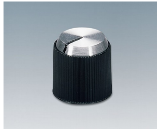
A1314240 DREHKNOPF, mit seidl. Schraubbefestigung PF (UL 94 V-0) schwarz/Alu 14,1x14mm 4mm