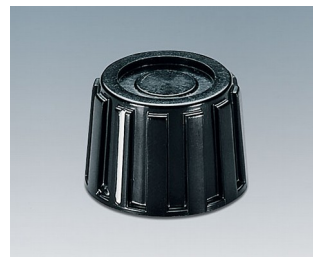
A1319260 DREHKNOPF, mit seidl. Schraubbefestigung PF (UL 94 V-0) schwarz RAL 9005 18,9x13,5mm 6mm