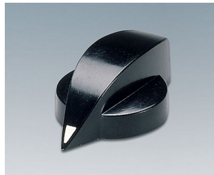
A1321860 DREHKNOPF, mit seittl. Schraubbefestigung PF schwarz RAL 9005 23x16mm 6mm