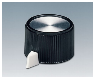
A1318560 DREHKNOPF, mit seidl. Schraubbefestigung PF (UL 94 V-0) schwarz/Alu 23,9x16mm 6mm