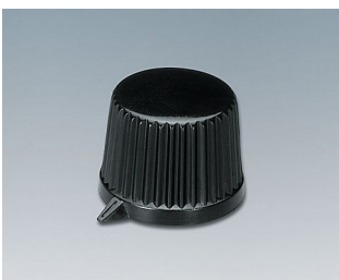
A1685540 DREHKNOPF, mit seittl. Schraubbefestigung PC schwarz RAL 9005 11,4x10,5mm 4mm