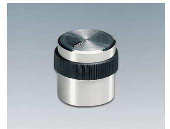
A1416449 DREHKNOPF, mit seittl. Schraubbefestigung ABS (UL 94 HB) glänzend 15,9x15mm 4mm