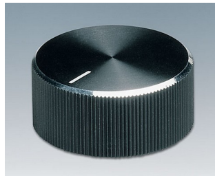
A1432260 DREHKNOPF, mit seittl. Schraubbefestigung ABS (UL 94 HB) schwarz/Alu 33x14,3mm 6mm