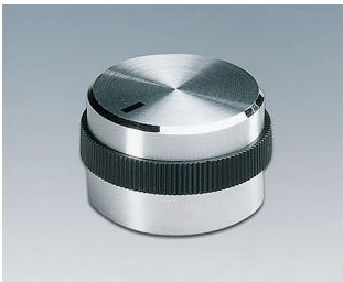
A1422469 DREHKNOPF, mit seittl. Schraubbefestigung ABS (UL 94 HB) glänzend 22,2x17,9mm 6mm