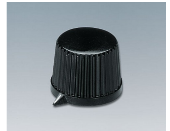
A1313540 DREHKNOPF, mit seitl. Schraubbefestigung PF schwarz RAL 9005 20x15,4mm 4mm