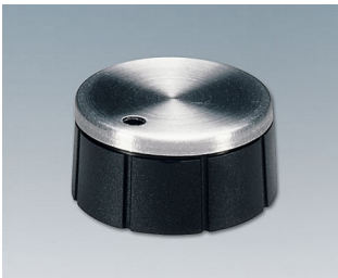
A1321260 DREHKNOPF, mit seittl. Schraubbefestigung PF schwarz/Alu 21x10mm 6mm