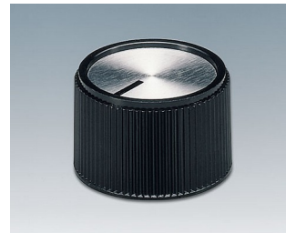
A1324260 DREHKNOPF, mit seittl. Schraubbefestigung PF schwarz/Alu 24,3x16mm 6mm