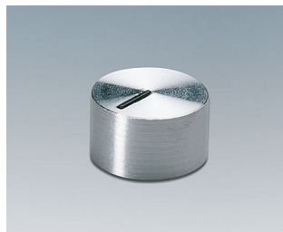
A1412441 DREHKNOPF, mit seittl. Schraubbefestigung PC glänzend 12x7,2mm 4mm