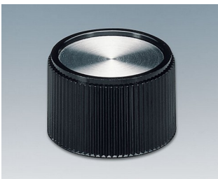
A1328160 DREHKNOPF, mit seittl. Schraubbefestigung PF schwarz/Alu 28x16mm 6mm