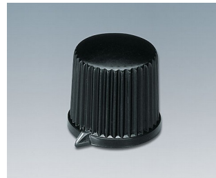
A1312560 DREHKNOPF, mit seidl. Schraubbefestigung ABS (UL 94 HB) schwarz RAL 9005 20,7x19,7mm 6mm