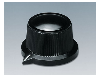
A1319560 DREHKNOPF, mit seitl. Schraubbefestigung PF schwarz RAL 9005 29x20,1mm 6mm