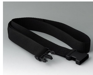
B7110139 Gurtband schwarz 1200x30mm