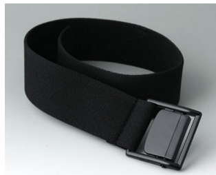
B7110129 Gurtband schwarz 450x35mm