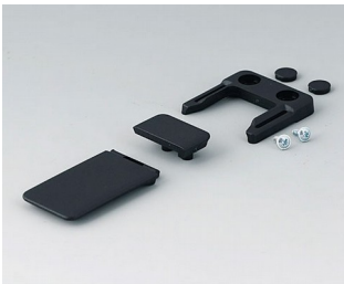
A9152049 Combi-Clip ABS (UL 94 HB) schwarz RAL 9005 45x27mm