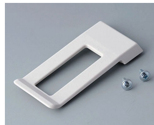
A9172107 Ansteckclip ABS (UL 94 HB) grauweiß RAL 9002 62x30mm