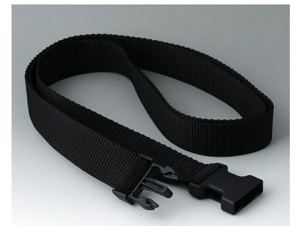
B7110149 Gurtband schwarz 1500x30mm