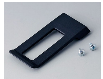
A9172109 Ansteckclip ABS (UL 94 HB) schwarz RAL 9005 62x30mm