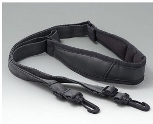
B4308650 Umhängegurt grau 1400mm