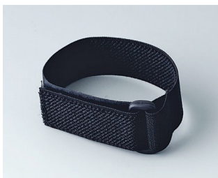
B9100033 Armband schwarz 280mm