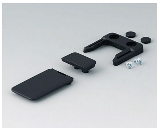
A9152049 Combi-Clip ABS (UL 94 HB) schwarz RAL 9005 45x27mm