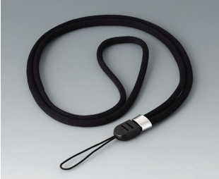
B9100063 Halsband, Textil schwarz 860mm

Technische Änderungen vorbehalten. © OKW Gehäusesysteme, Buchen/Deutschland.