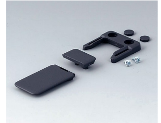
A9152048 Combi-Clip ABS (UL 94 HB) lava 45x27mm