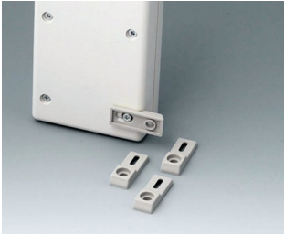
A9204108 Befestigungslaschen, Wand PA 6 kieselgrau RAL 7032