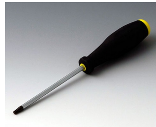
A0399T20 Torx Schraubendreher T20