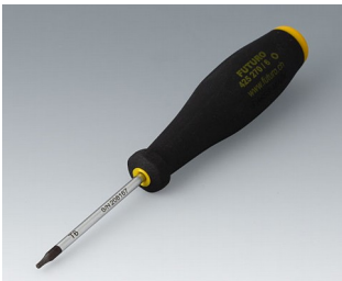
A0399T06 Torx Schraubendreher T6