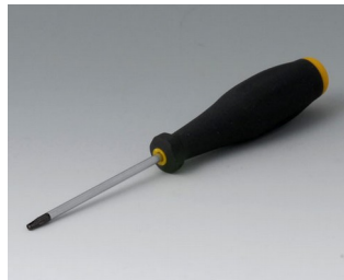
A0399T08 Torx Schraubendreher T8